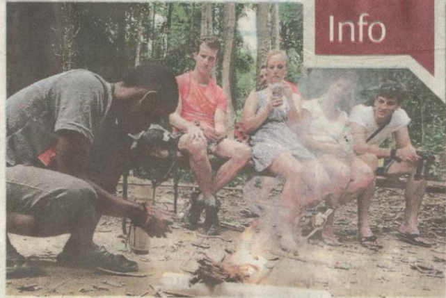
Demonstrasi menyalakan api menggunakan rotan dan kayu meranti.