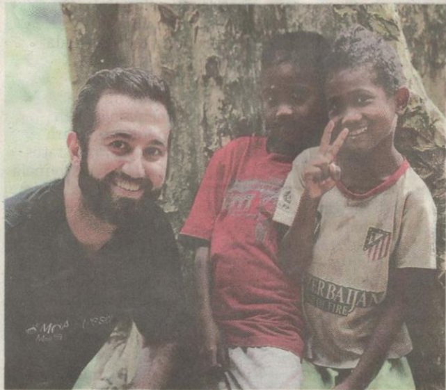
Pelancong Barat beramah mesra dengan kanak-kanak.