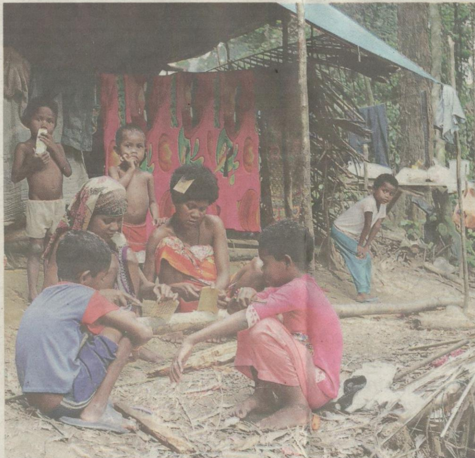
Wanita dan kanak-kanak Orang Asli Bateq leka menyiapkan kraf tangan.

manakala pakaian yang didisai di ampaian, sesetengahnya dijadikan