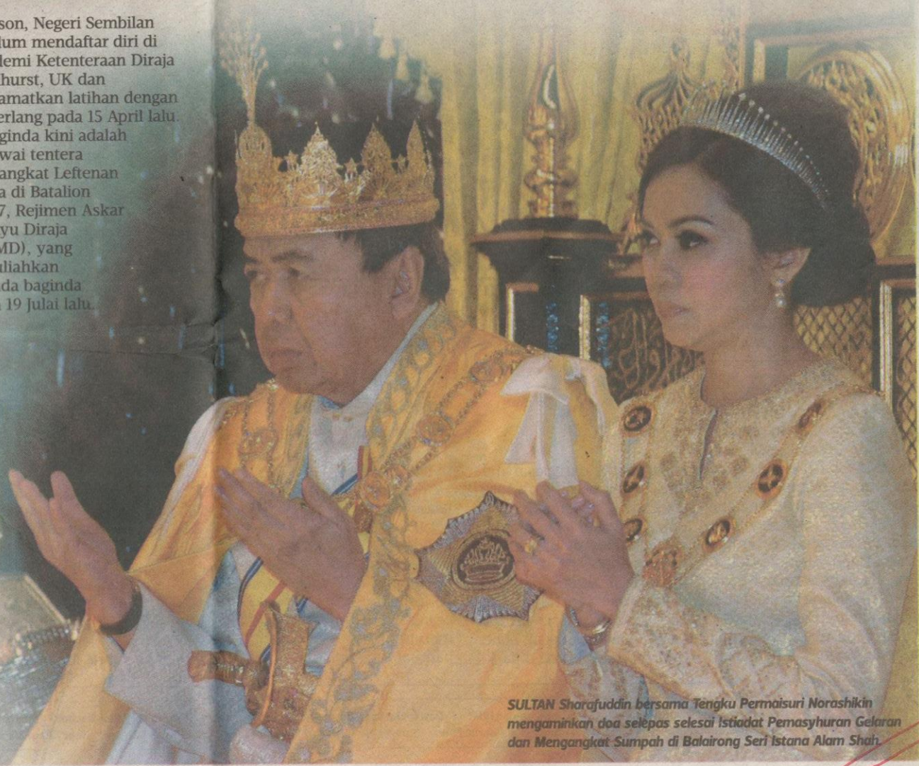
SULTAN Sharafuddin bersama Tengku Permaisuri Norashikin mengaminkan doa selepas selesai Istiadat Pemasyhuran Gelaran dan Mengangkat Sumpah di Balairong Seri Istana Alam Shah.

Baginda kini adalah pegawai tentera berpangkat Leftenan Muda di Batalion ke-17, Rejimen Askar Melayu Diraja (RAMD), yang ditauliahkan kepada baginda pada 19 Julai lalu.