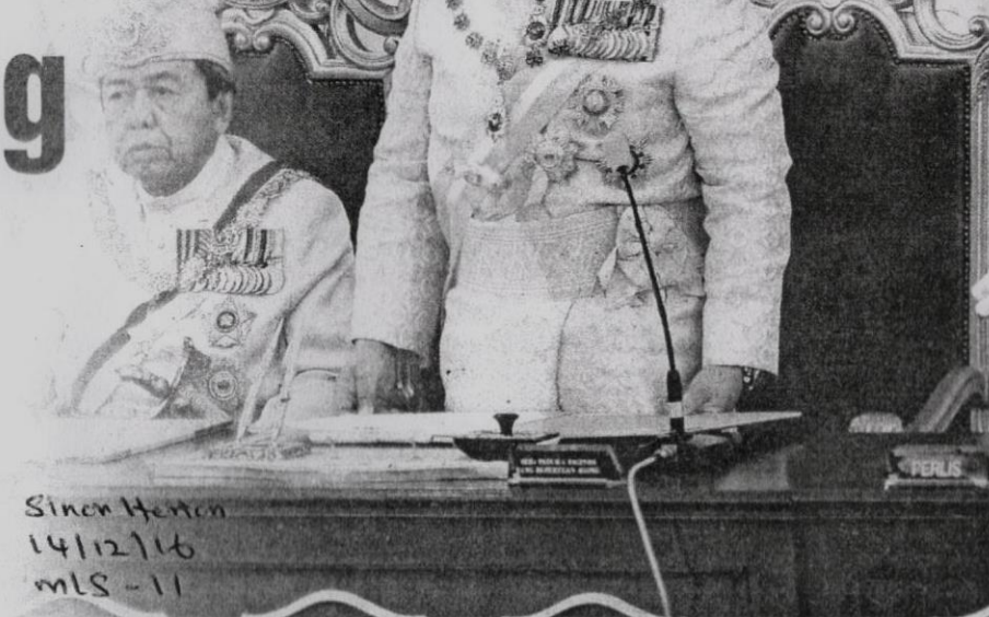
Sultan Muhammad V berkenan melafaz sumpah memegang jawatan sebagai Yang di-Pertuan Agong ke-15 pada Mesyuarat Majlis Raja-Raja Ke-244 (Khas) sempena Istiadat Melafaz Sumpah dan Menandatangani Surat Sumpah Jawatan Yang di-Pertuan Agong ke-15