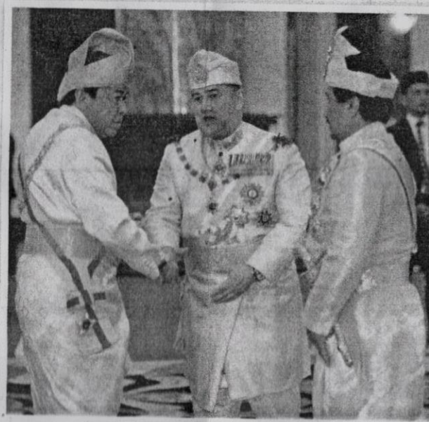
Sultan Muhammad V bersalaman dengan Sultan Sharafuddin sambil diperhatikan Sultan Mizan Zainal Abidin.

Acara di balairung seri kemudiannya diteruskan dengan istiadat menandatangani perisytiharan memegang jawatan oleh Yang di-Pertuan Agong dan timbalannya.