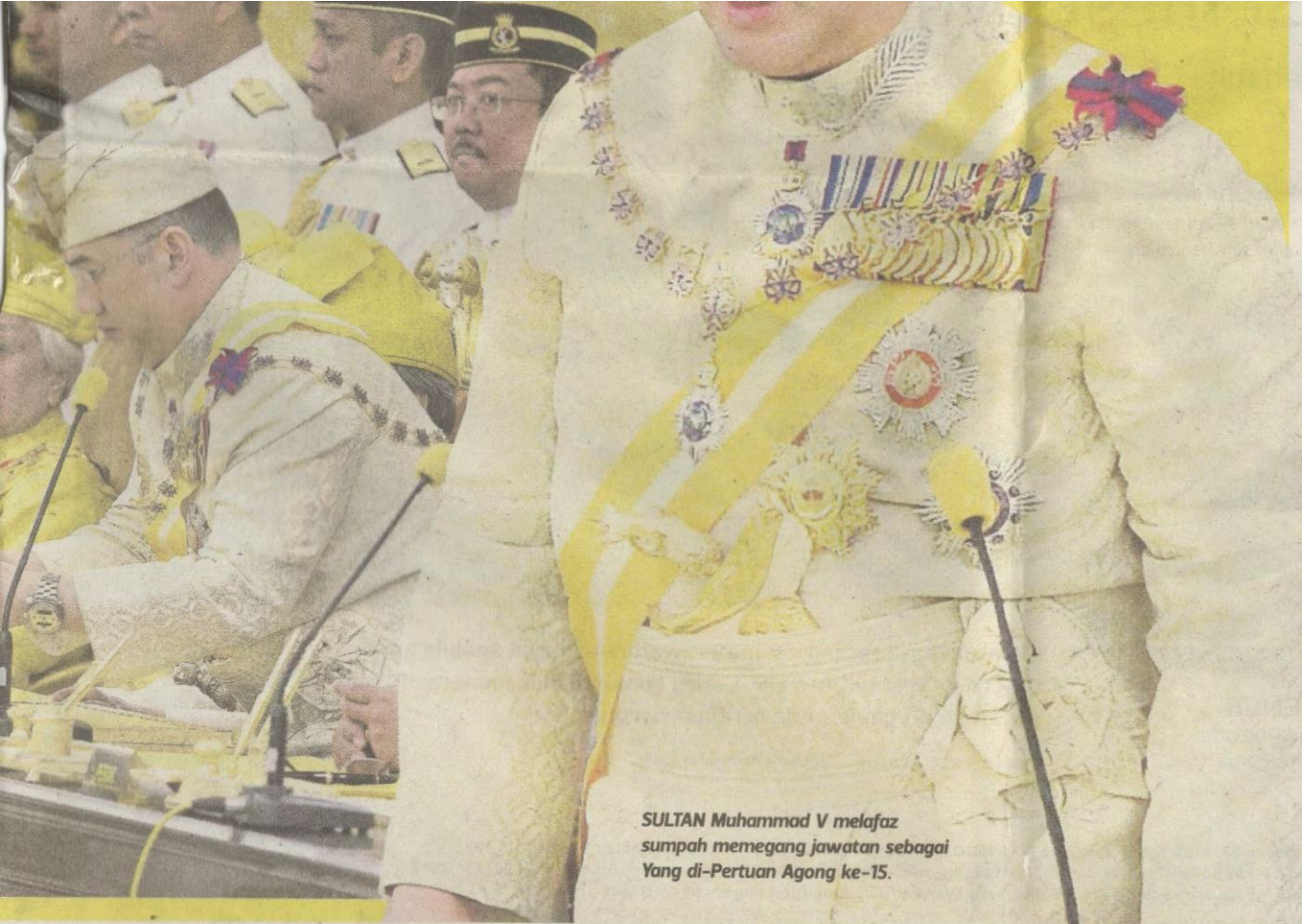
SULTAN Muhammad V melafaz sumpah memegang jawatan sebagai Yang di-Pertuan Agong ke-15.

Baginda yang gemarkan aktiviti lasak seperti bermain go-kart, menembak, memamah, badminton, boling dan bola sepak turut menggalakan rakyat bersama baginda menyertai Program Walkathon D'Raja Kelantan sejak 2011 dengan berjalan sejauh 10 kilometer di Kota Bharu.