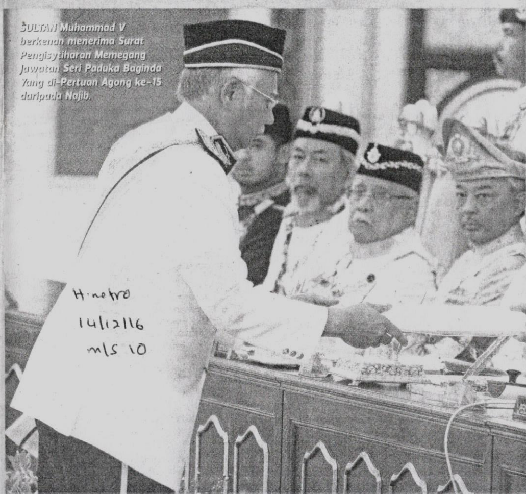
SULTAN Muhammad V berkenan menerima Surat Pengisytiharan Memegang Jawatan Seri Paduka Baginda Yang di-Pertuan Agong ke-15 daripada Najib.