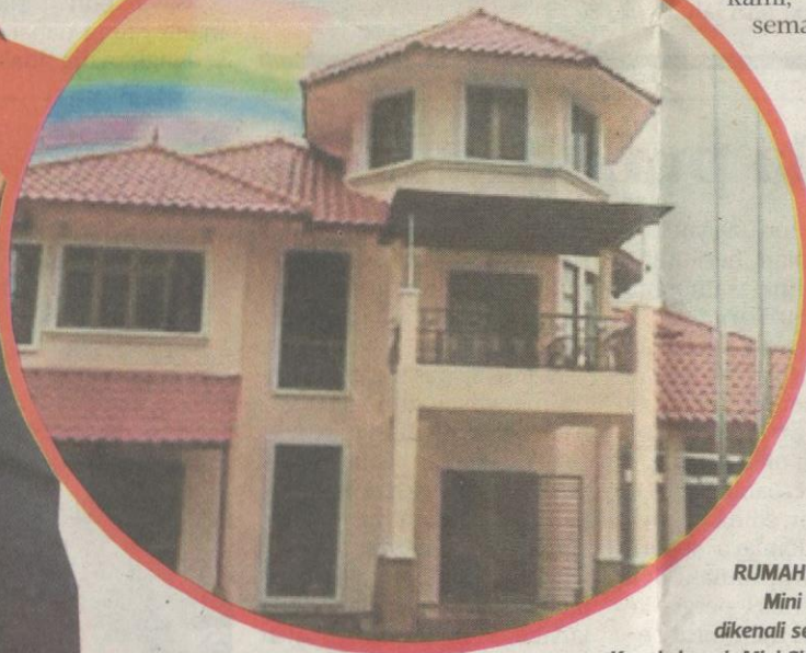
RUMAH Kanak-kanak Mini di Johor bakal dikenali sebagai Rumah Kanak-kanak Mini Siti Noor Radiah Ismail