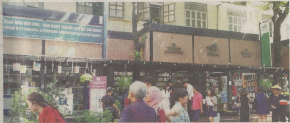
LORONG di Nguyen Van Binh dipenuhi kedai-kedai buku untuk dijual kepada para pengunjung.

MAKANAN halal boleh didapati di Restoran D'Nyonya yang terletak di Dong Du.