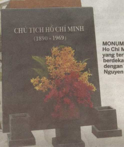
MONUMEN Ho Chi Minh yang terletak berdekatan dengan Jalan Nguyen Hue.