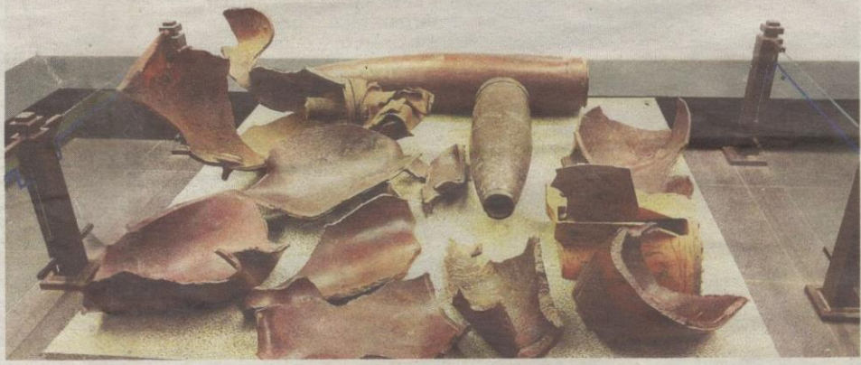
ARTIFAK peninggalan perang yang terdapat di The War Remnants Museum.