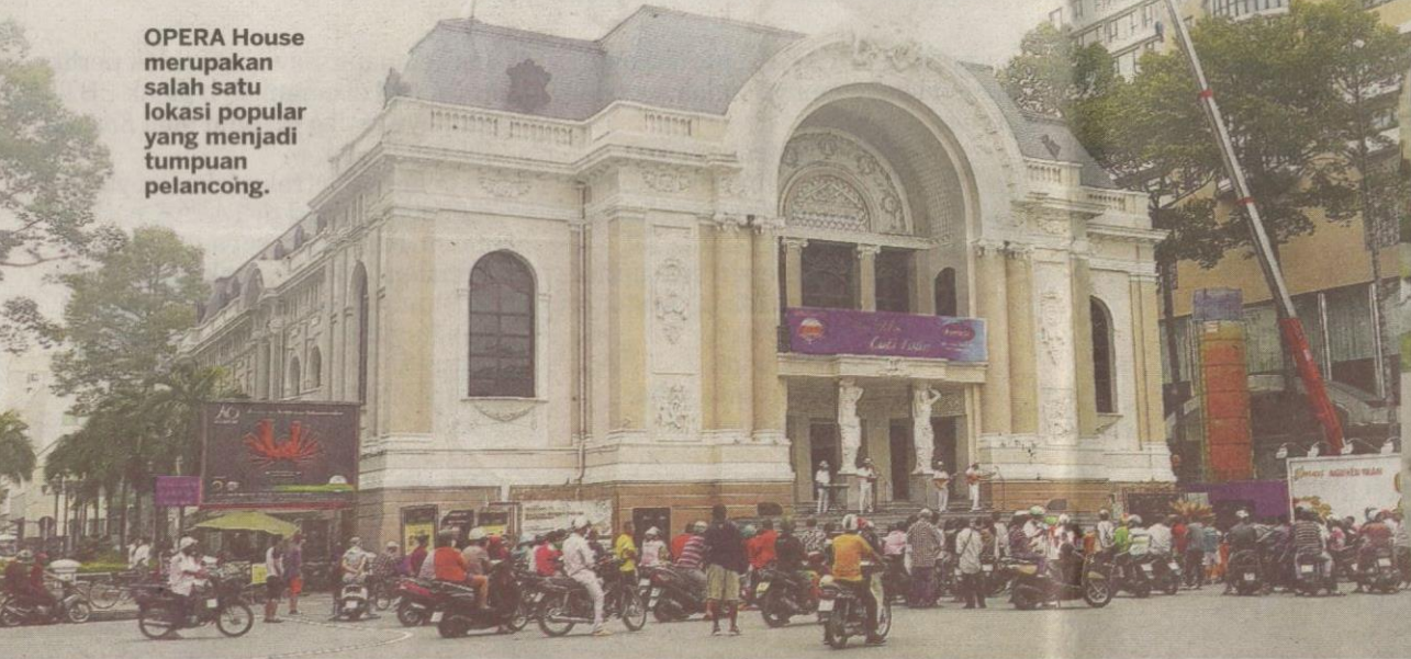
OPERA House merupakan salah satu lokasi popular yang menjadi tumpuan pelancong.

Umur: 35 tahun Asal: Petaling Jaya, Selangor Pekerjaan: Pensyarah Kanan Pusat Pengajian Media dan Komunikasi, Universiti Kebangsaan Malaysia (UKM), Bangi, Selangor Negara pernah dilawati: Austria, Republik Czech, Hungary, Switzerland, Slovakia, Itali Negara ingin dilawati: Jepun, Turki, New Zealand