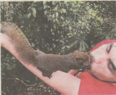
Melayan tupai jinak.

Sumber: Wikipedia senarai gunung di Malaysia