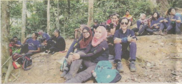
Berehat di kem pacat.