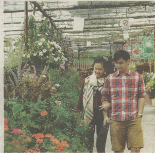
Suasana romantik di kebun bunga dan sayur-sayuran.

Ada juga dalam kalangan pengunjung yang begitu teruja melihat kesegaran sayur-sayuran di kawasan berkenaan seperti daun salad yang terdiri daripada spesies karang merah dan karang hijau. Umpama permaidani merah dan hijau di sekitar kawasan berkenaan.