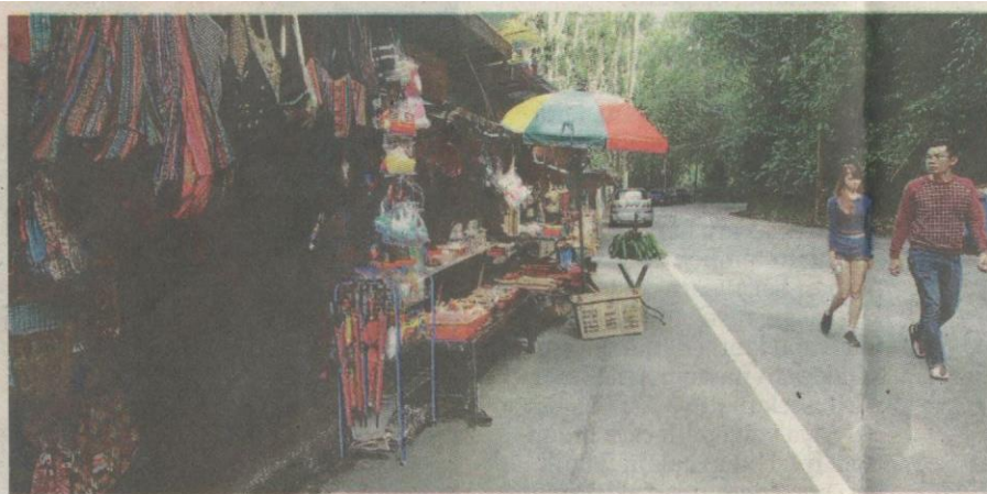
Gerai menjual kraf tangan di sekitar lata Iskandar.