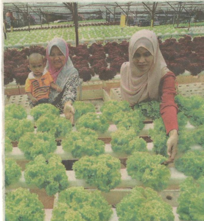
Daun salad spesies karang hijau tarik perhatian.

yang sangat hebat, iaitu berselisih atau mengekori kenderaan berat sepanjang laluan dari Tapah!