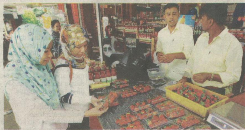
Pengunjung tidak lepas peluang beli strawberi segar.