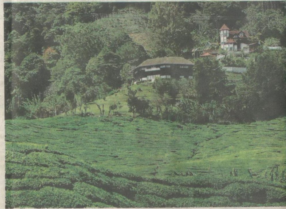
Peningapan mewah bentuk kolonial di Kebun Teh Sungei Palas.

Jika hendak mandi dengan tenang, disirami kesegaran dan kedinginan air terjun yang berpunca dari atas bukit, berkunjunglah ke sana pada hari bekerja, mungkin kolam air terjun itu menjadi milik persendirian anda!