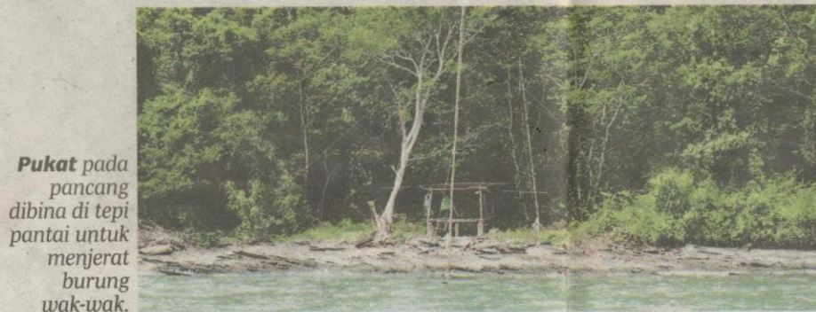
Pukat pada pancang dibina di tepi pantai untuk menjerat burung wak-wak.

rumah kampung dibina di sepanjang pantai kerana rata-rata penduduknya bekerja sebagai nelayan.