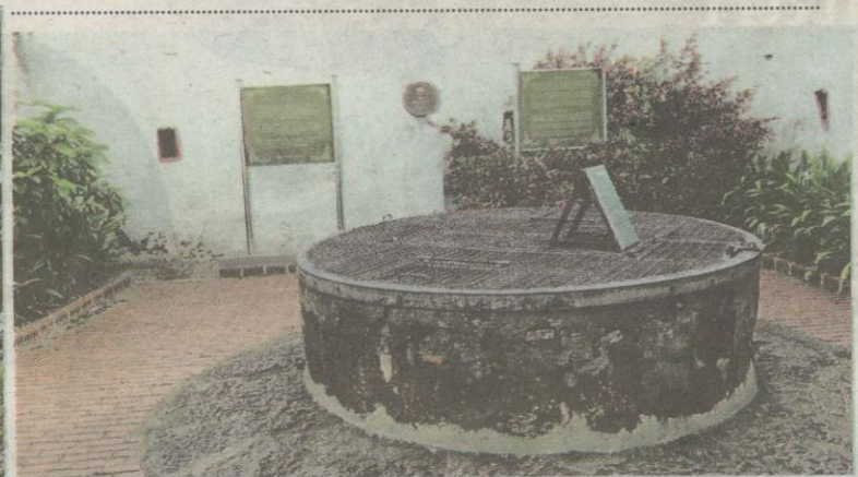
Perigi Puteri Hang Li Po.