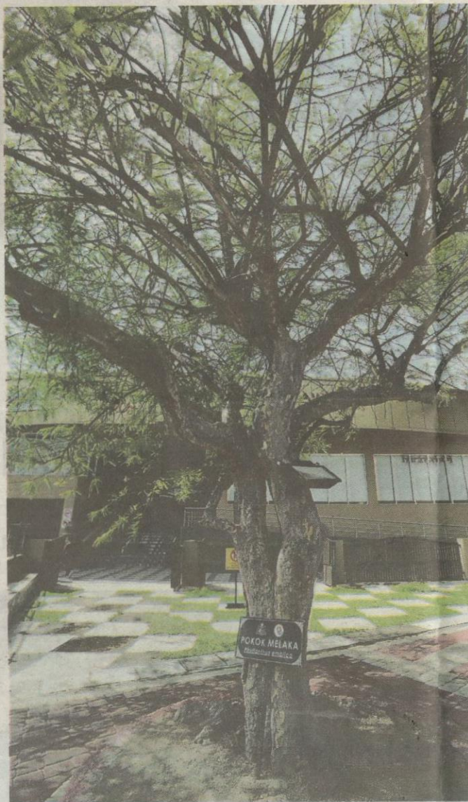
Parameswara dikatakan pernah bersandar pada Pokok Melaka.

→ Apabila Belanda mengambil alih pemerintahan Portugis di Melaka pada tahun 1641, mereka menambah baik A' Famosa dan meletakkan lambang VOC iaitu Verenigde Oostindische Compagnie berserta tahun siap dibaiki pada tahun 1670.