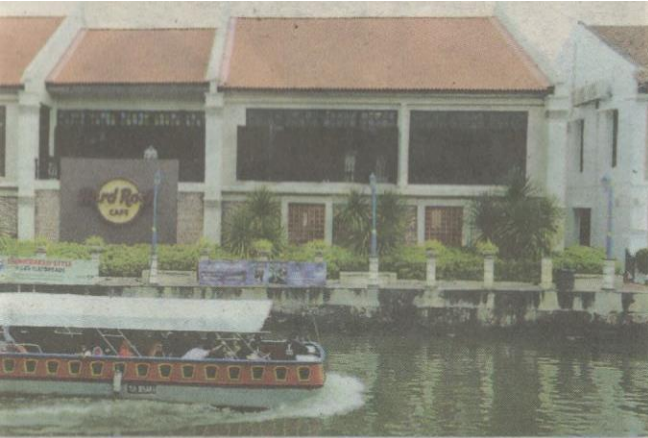
Menelusuri Sungai Melaka.