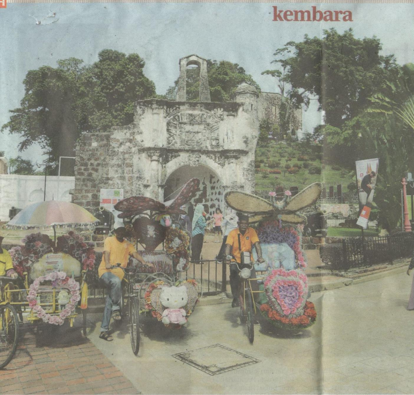
Beca dan Kota A' Famosa antara ikonik terkenal Bandar Raya Melaka Bersejarah.