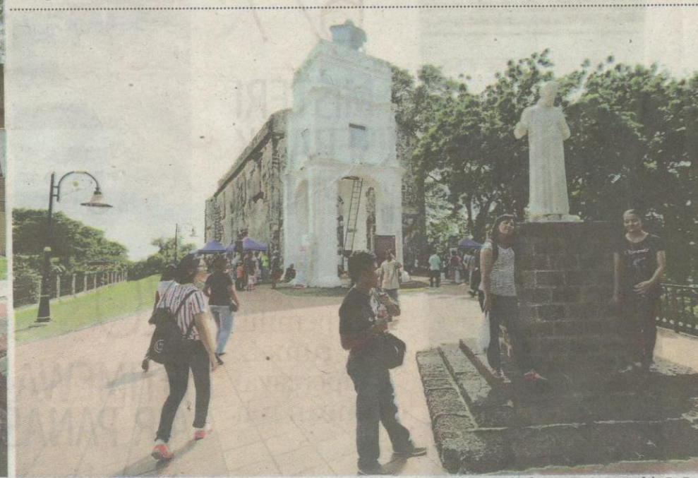
Pemandangan atas Bukit St Paul.