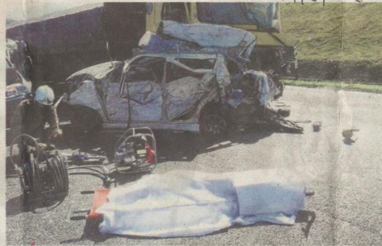
MAYAT dua mangsa ditutup dengan kain selepas tersepit di dalam kereta Suzuki Swift dalam nahas ngeri di Kilometer 405.8 Lebu Raya Utara-Selatan susur masuk Lembah Beringin semalam.

“Akibat pelanggaran itu, banyak kenderaan lain yang tidak sempat mengelak menyebabkan berlaku pelanggaran lebih besar,” katanya di