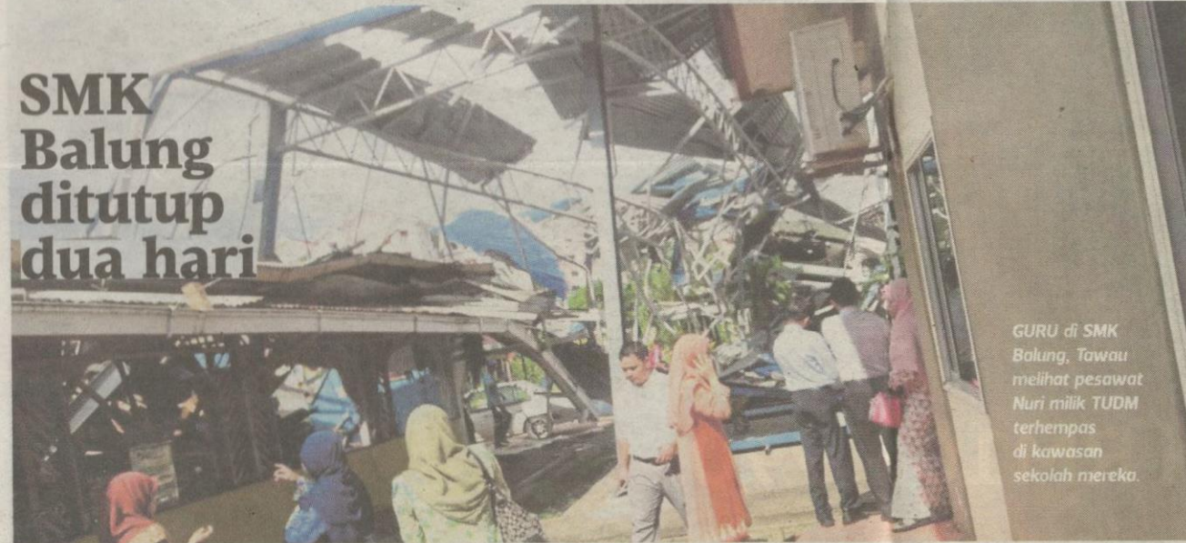
GURU di SMK Balung, Tawau melihat pesawat Nuri milik TUDM terhempas di kawasan sekolah mereka.

Putrajaya: Sekolah Menengah Kebangsaan (SMK) Balung, Tawau, Sabah ditutup dua hari iaitu semalam dan hari ini susulan insiden helikopter Nuri milik Tentera Udara Diraja Malaysia (TUDM) yang terhempas di kawasan sekolah itu.