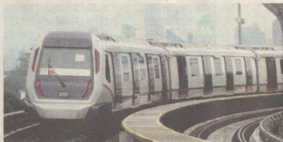
PERKHIDMATAN MRT fasa satu dari Sungai Buloh ke Semantan akan mula beroperasi esok.

haru pengangkutan rel awam sebagai tambahan kepada Transit Aliran Ringan (LRT), komuter, monorel dan Express Rail Link (ERL).