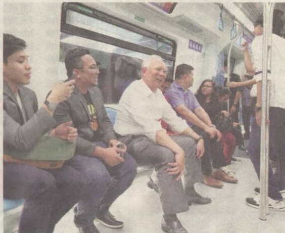
NAJIB merasai pengalaman menaiki MRT bersama rakan online Perdana Menteri baru-baru ini.

Rata-rata mereka berpendapat perkhidmatan MRT memberikan satu lagi alternatif ba-