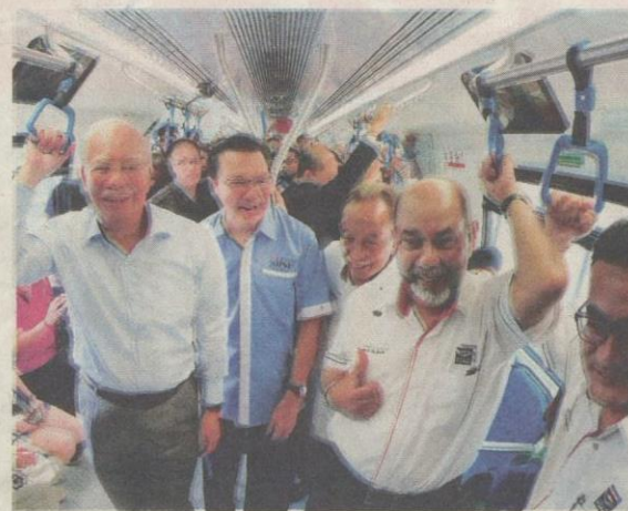
NAJIB bersama Tiong Lai (dua dari kiri) dan Syed Hamid (dua dari kanan) menaiki perkhidmatan MRT dari Stesen Kwasa Damansara ke Sungai Buloh semalam.