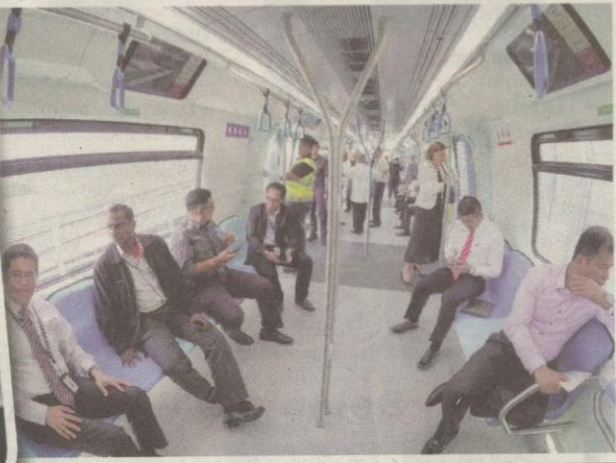
TETAMU pada majlis perasmian pelancaran perkhidmatan Mass Rapid Transit (MRT) Sungai Buloh-Kajang fasa satu cuba perkhidmatan tren itu dari Stesen Kwasa Damansara ke Sungai Buloh semalam.