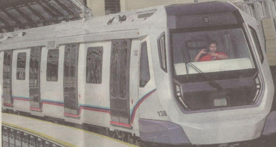
TREN MRT bergerak lancar selepas perkhidmatan tersebut dirasmikan Perdana Menteri di Stesen Kwasa Damansara, Petaling Jaya semalam.