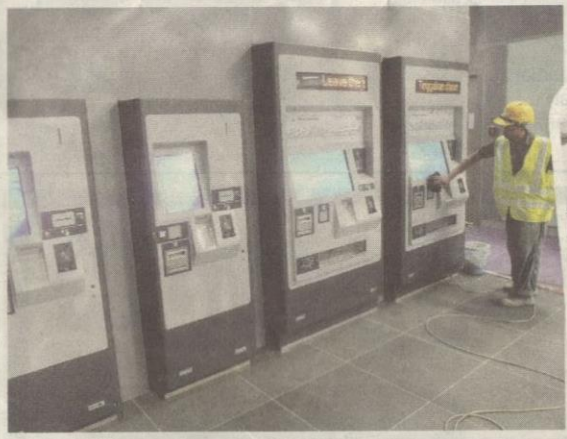
SEORANG pekerja membuat pemeriksaan ke atas mesin pembelian tiket perkhidmatan MRT Sungai Buloh-Kajang menjelang pembukaan operasinya kepada orang ramai hari ini.