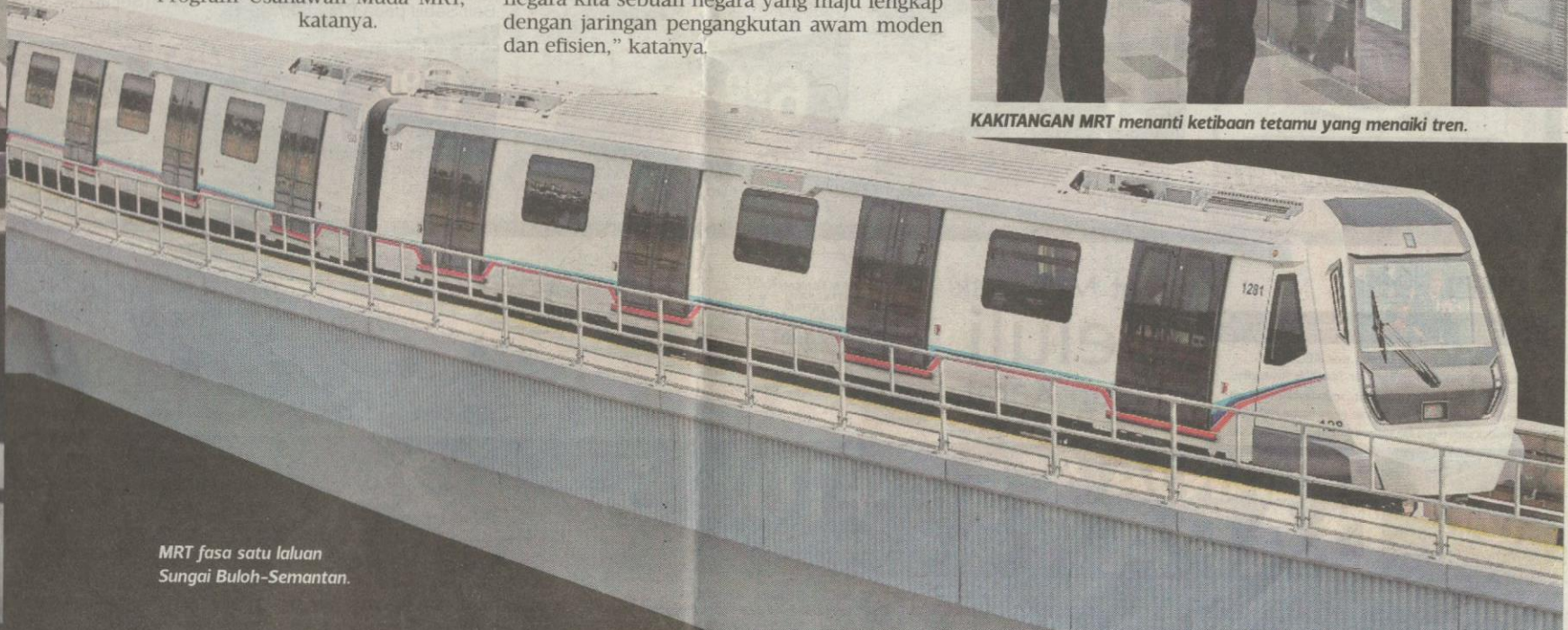
MRT fasa satu laluan Sungai Buloh-Semantan.