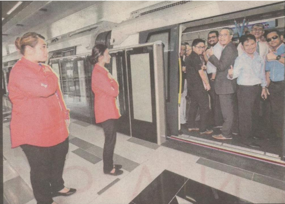
PENUMPANG menunjukkan isyarat bagus ketika Pelancaran MRT Fasa 1 laluan Sungai Buloh-Semantan.