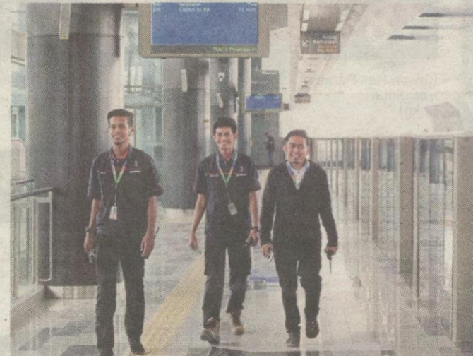
JURUTEKNIK penyelenggaraan MRT meninjau sekitar stesen di Sungai Buloh.