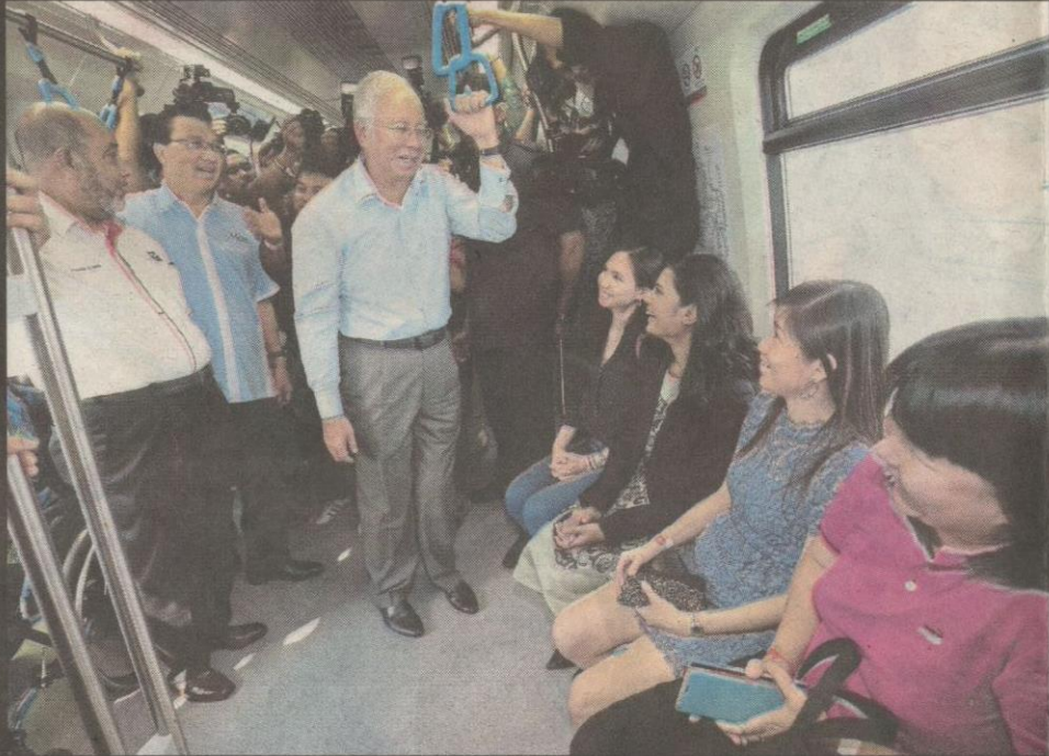
Najib dan Liow (dua dari kiri) beramah mesra bersama penumpang MRT.