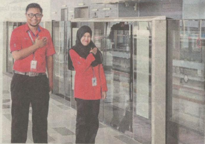
KAKITANGAN MRT menanti ketibaan tetamu yang menaiki tren.

"Projek MRT ini akan memartabatkan Malaysia selangkah lagi ke hadapan menjadikan negara kita sebuah negara yang maju lengkap dengan jaringan pengangkutan awam moden dan efisien," katanya.