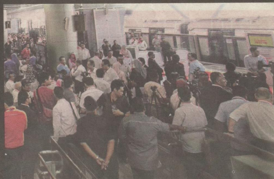
ANTARA jemputan yang berpeluang menaiki MRT ketika majlis Pelancaran MRT Fasa 1 laluan Sungai Buloh-Semantan.