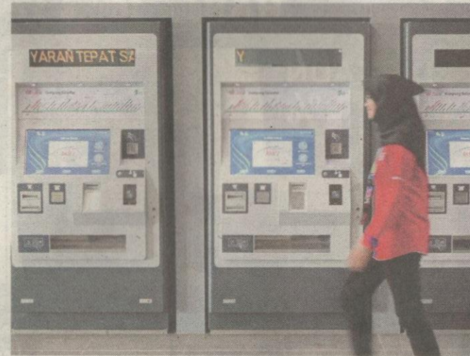
KAUNTER tiket elektronik di stesen MRT Kampung Selamat, Sungai Buloh.

Hadir sama Menteri Pengangkutan Datuk Seri Liow Tiong Lai dan Ketua Setiausaha Negara merangkap Pengerusi Lembaga Pengarah MRT Copr Tan Sri Dr Ali Hamsa.