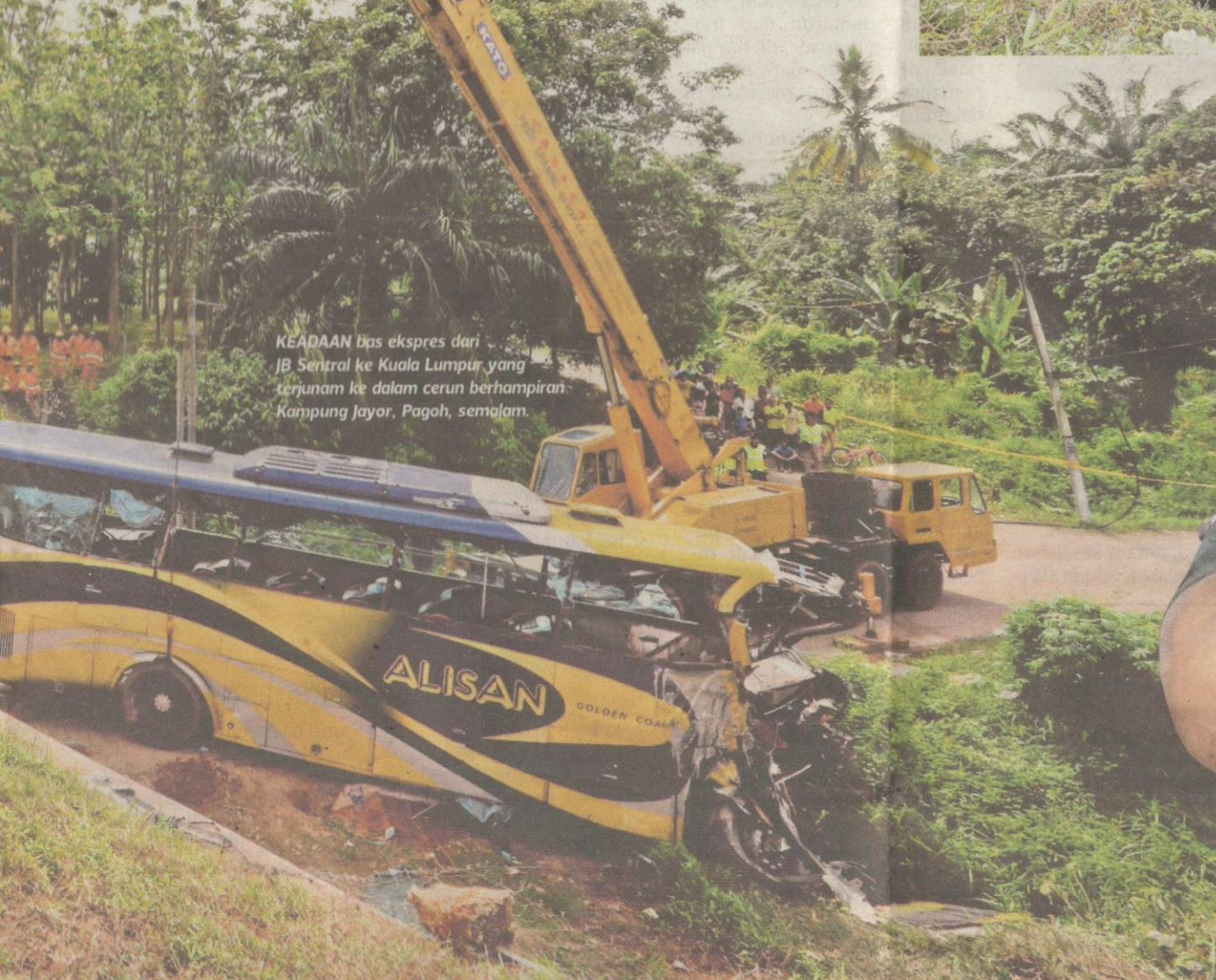
KEADAAN bas ekspres dari JB Sentral ke Kuala Lumpur yang terjunam ke dalam cerun berhampiran Kampung Jayor, Pagoh, semalam.