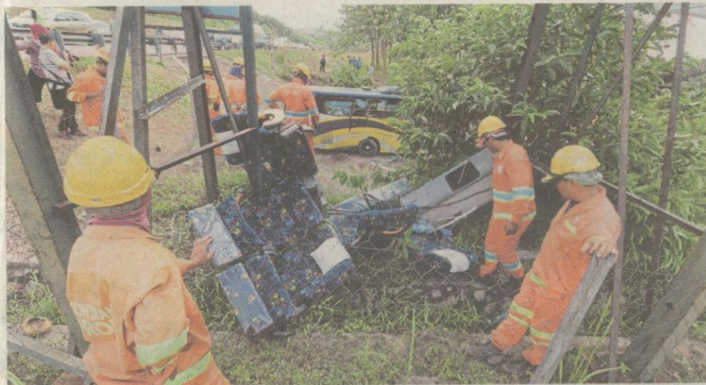
PEKERJA melakukan kerja pembersihan sebaik semua mangsa dibawa keluar.