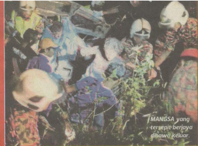
MANGSA yang tersepit berjaya dibawa keluar.