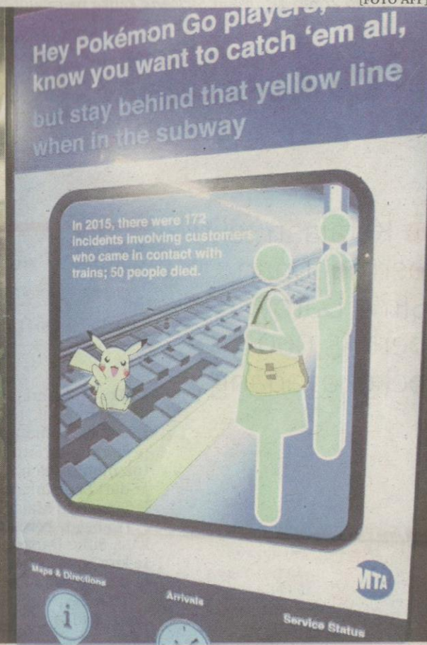
Mesej keselamatan dipamerkan di stesen kereta api bawah tanah di New York sebagai amaran kepada pengguna ketika bermain Pokemon Go di telefon bimbit masing-masing.