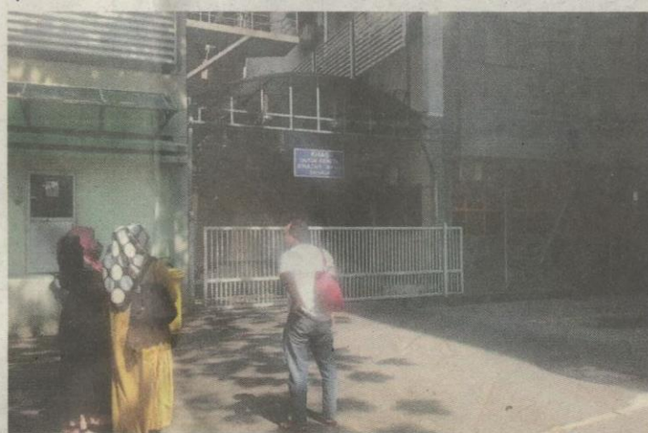
ANGGOTA keluarga dan saudara menunggu keputusan bedah siasat Rania.

“Siasatan lanjut dilakukan bagi mengenal-pasti individu yang terbabit mendera mangsa. Kes disiasat mengikut Seksyen 302 Kanun Keseksaan,” katanya.