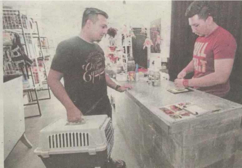
Pelanggan yang membawa kucing untuk dijaga dan mendapatkan rawatan di Cat Walk Studio, Ayer Keroh.