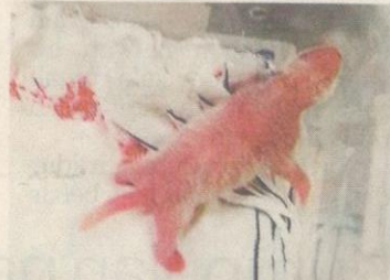
NUAN NUAN hanya sebesar tapak tangan sewaktu dilahirkan ibunya.