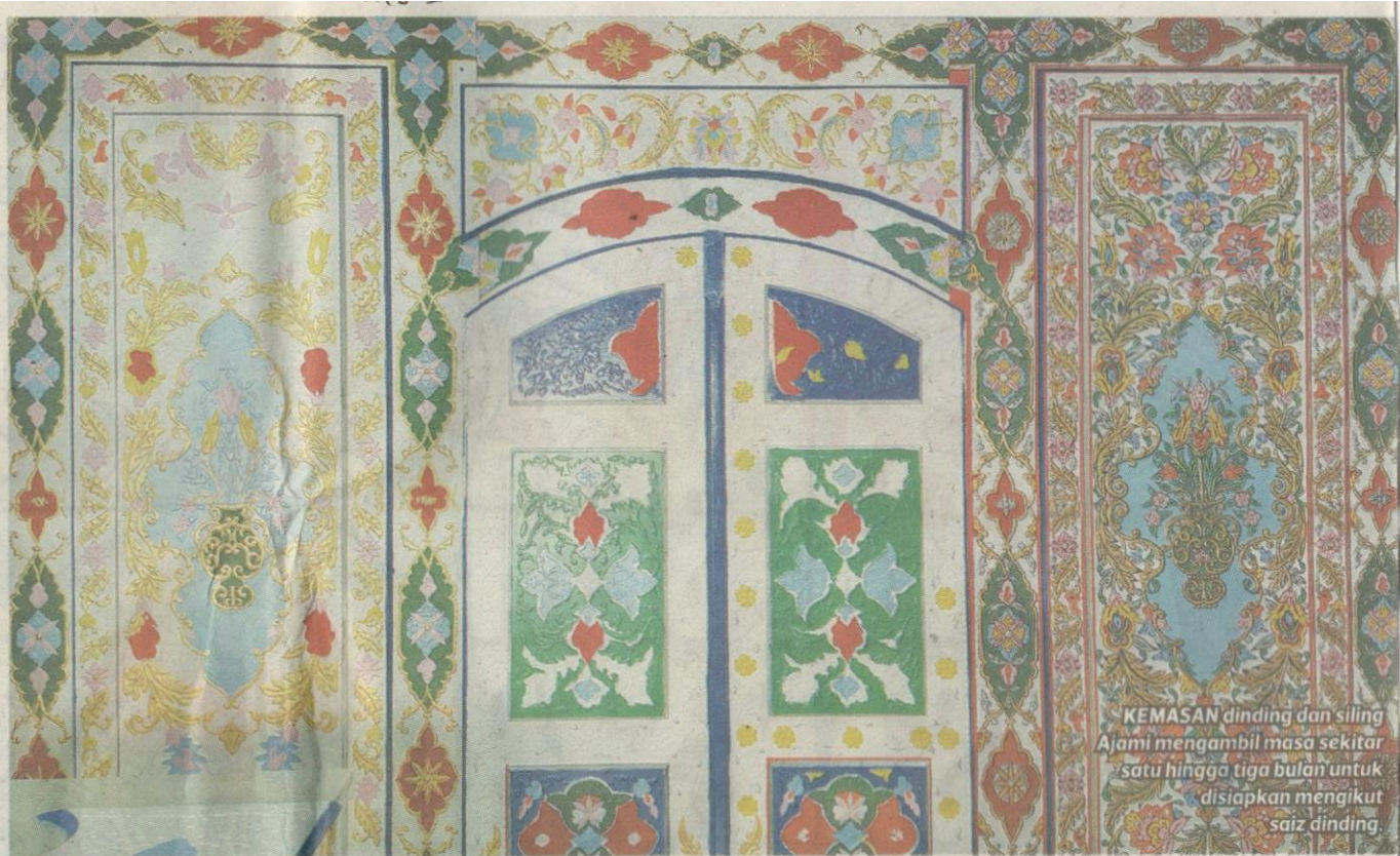
KEMASAN dinding dan siling Ajami mengambil masa sekitar satu hingga tiga bulan untuk disiapkan mengikut saiz dinding.

Di Syria, ia menjadi pilihan golongan atasan dan kerja tangan itu dianggap lambang kebanggaan serta aset kerana mempunyai nilai yang tinggi