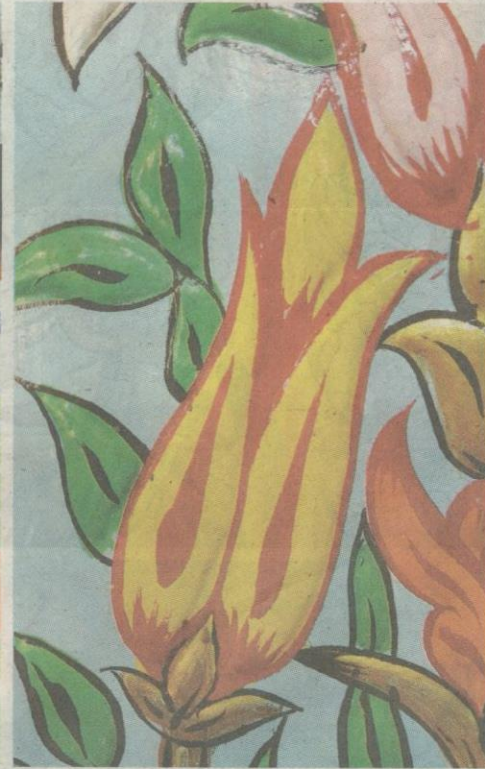
AJAMI mengetengahkan pelbagai corak bunga antaranya bunga lili.

latar serta corak sekaligus menjadikan ia bukan saja menarik malah boleh disentuh teksturnya.