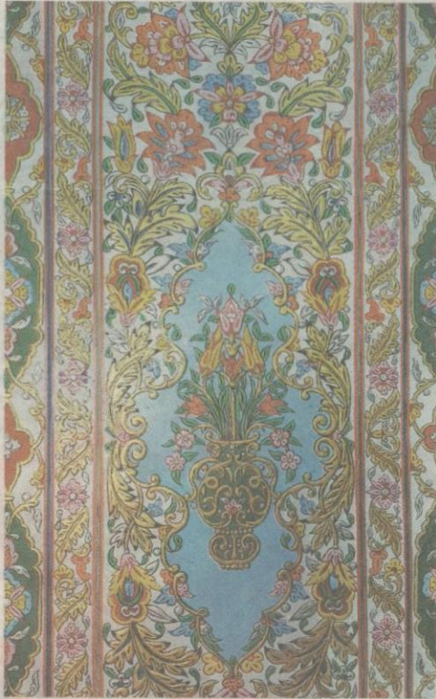
ANTARA kemasan dinding yang sudah siap sepenuhnya.