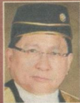
TAN SRI RICHARD MALANJUM