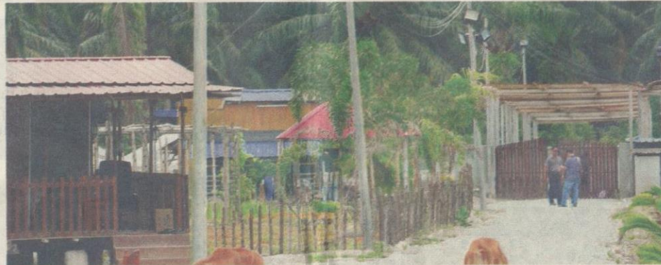
INILAH lokasi pembunuhan Sosilawati dan tiga rakannya di sebuah ladang di Banting, Selangor.