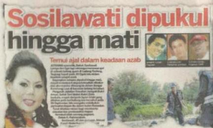
KERATAN Kosmo! 13 September 2010.