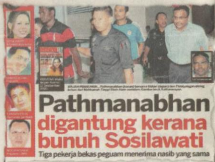
KERATAN Kosmo! 24 Mei 2013.