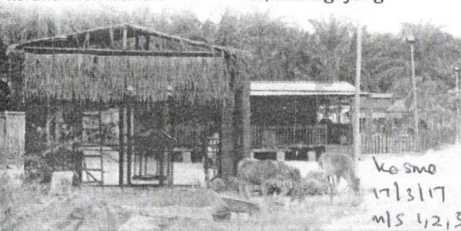
KAWASAN ladang di Banting yang menjadi lokasi pembunuhan Sosilawati dan tiga individu lain di Tanjung Sepat, Banting, Selangor pada tahun 2010.