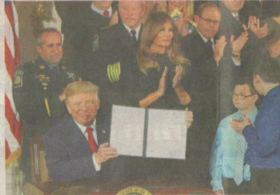
TRUMP menunjukkan memorandum yang ditandatangani bagi mengisytiharkan perang dalam menangani krisis dadah di AS yang semakin membimbangkan di Washington DC baru-baru ini.