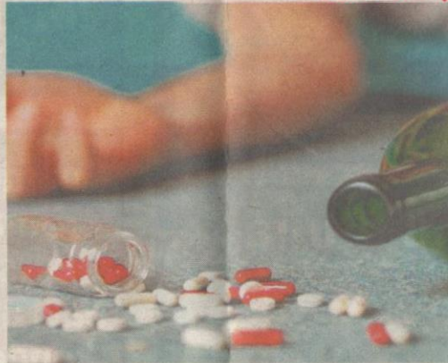
KETAGIHAN opioid tidak hanya melibatkan dadah tetapi juga ubat-ubatan yang diambil secara berlebihan.

Majlis Penasihat Ekonomi (CEA) AS menganggarkan krisis opioid mengakibatkan kerugian mencecah AS$504 bilion (RM2.06 trilion) kepada ekonomi negara dalam tahun