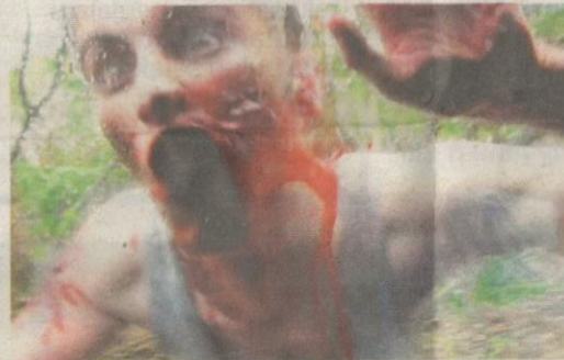
PENAGIH dadah jenis Flakka boleh bertukar menjadi ganas yang disamakan dengan zombie.