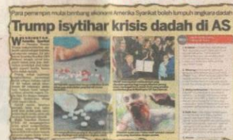
KERATAN Kosmo! 4 November 2017.

“Selain itu, NPS juga mampu memberikan kesan khayal lebih berbahaya daripada dadah tradisional dan sintetik,” katanya ketika dihubungi Kosmo! semalam.