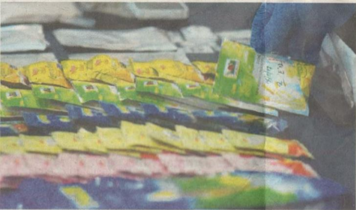
DADAH sintetik NPS yang dibungkus dalam paket minuman dalam satu rampasan polis di Kajang, Selangor pada November lalu.