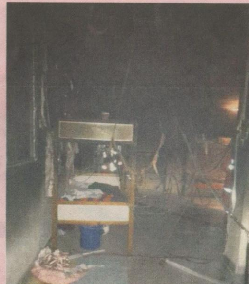
KEADAAN sebuah bilik asrama di tingkat dua ATIQ, Shah Alam yang hangus dalam satu kebakaran malam kelmarin.

Katanya, punca dan nilai kerugian masih dalam siasatan.