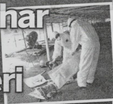
DUA kakitangan Jabatan Perkhidmatan Veterinar melakukan operasi memusnahkan unggas di Kampung Kedondong, Pasir Mas semalam.