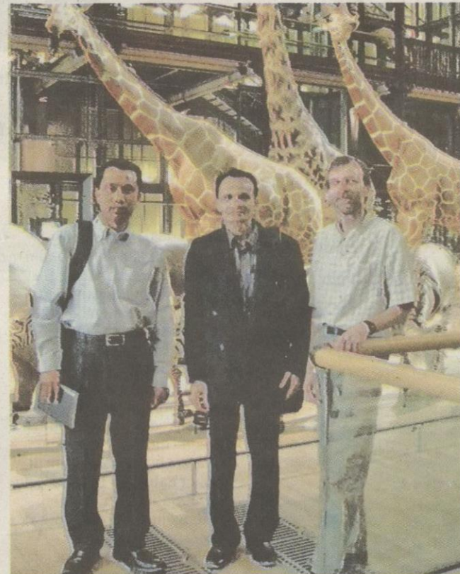
KETIKA menjalani latihan di Museum National D’Histoire Naturelle, Perancis.

Belakang lelaki berasal dari hari ini, menghadkan