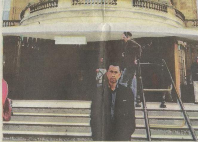
KETIKA berada di London.