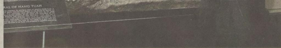
MENGHARGAI warisan sejarah.

namun ia dapat diselesaikan dengan cara terbaik.