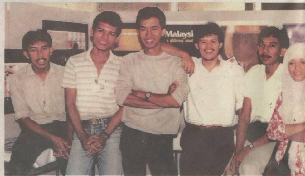
BERSAMA rakan fakulti pada 1987.