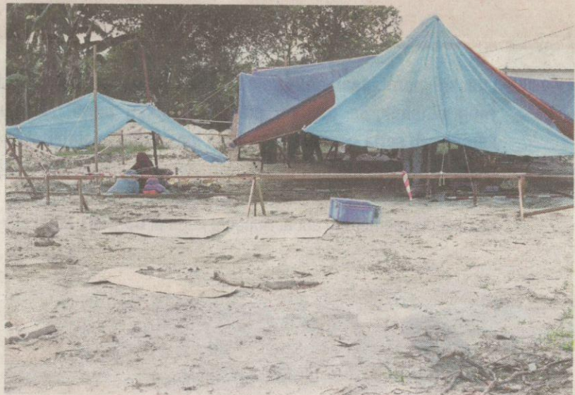
Kerja ekskavasi masih dijalankan di 60 petak yang ditanda di Kampung Guar Kepah, Kepala Batas.