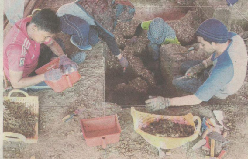
Ahli arkeologi USM menemui rangka purba pada 17 April lalu.

“Kerja ekskavasi masih dijalankan di 60 petak yang ditanda, manakala Galeri Arkeologi Guar Kepah dijangka siap pada Oktober ini dan rangka ditemui akan ditempatkan di situ,” katanya.