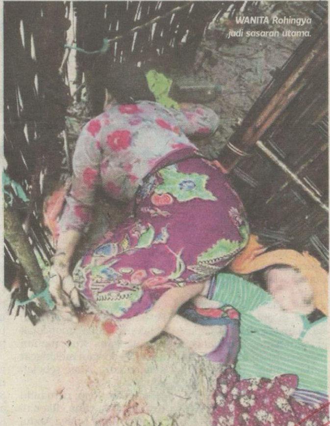
WANITA Rohingya jadi sasaran utama.

Katanya, ia digerakkan sebaik serangan dilancarkan di Arakan dan bantuan menyeluruh diperlukan memandangkan jumlah mangsa yang terjejas begitu ramai.