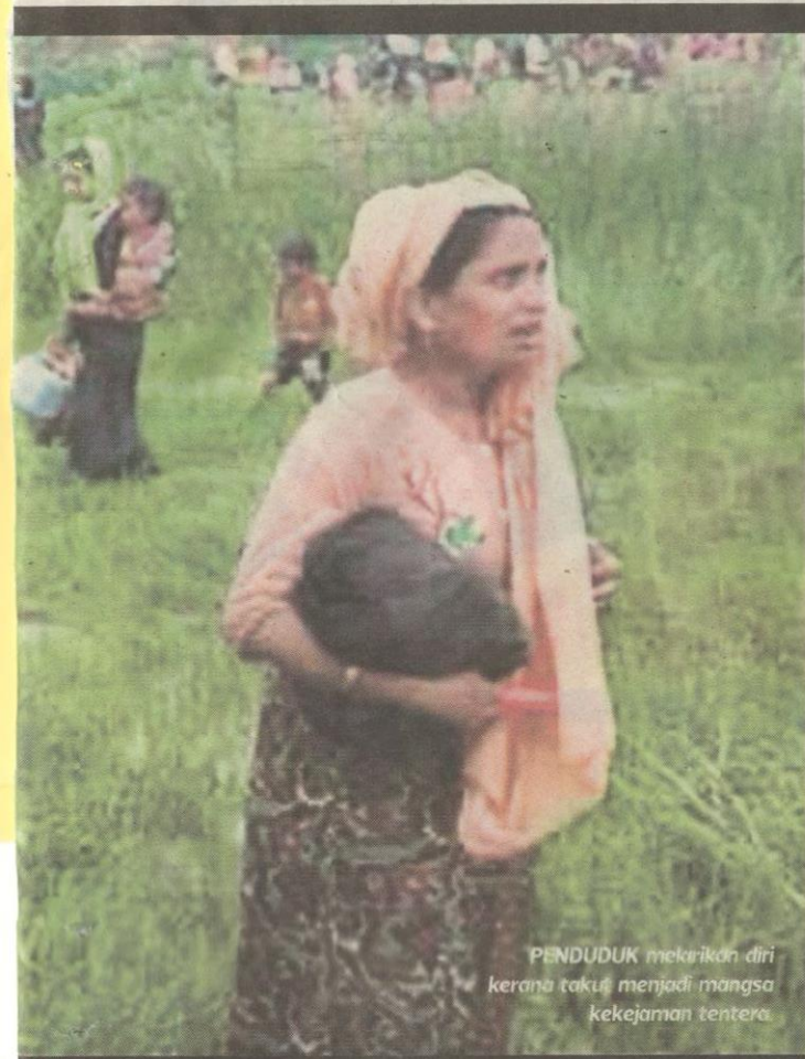
PENDUDUK melarikan diri kerana takut menjadi mangsa kekejaman tentera.