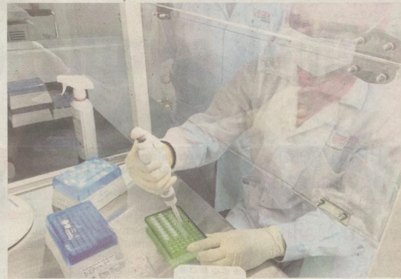
Sampel primer dimasukkan ke dalam bekas khas untuk diuji.

BH PLUS di www.bharian.com.my untuk lebih gambar dan video