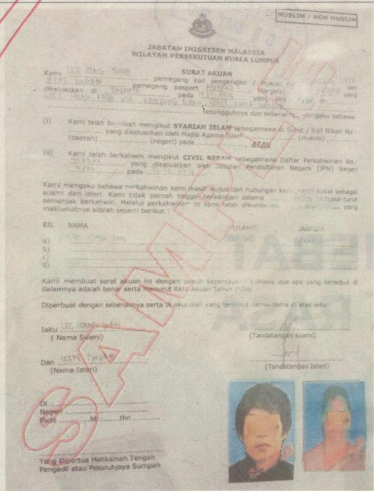
Contoh dokumen yang perlu dilengkapkan warga asing untuk perkahwinan dengan rakyat tempatan.

→ Imigresen dakwa ada jabatan agama tak ikut peraturan