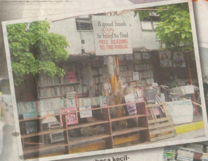
DARIPADA sudut membaca kecil-kecilan, perpustakaan Guanlao menempatkan hampir 4,000 buah buku pelbagai judul.

PERPUSTAKAAN Guanlao membantu kanak-kanak yang tidak bersekolah kerana kesempitan wang untuk belajar membaca dan menulis.