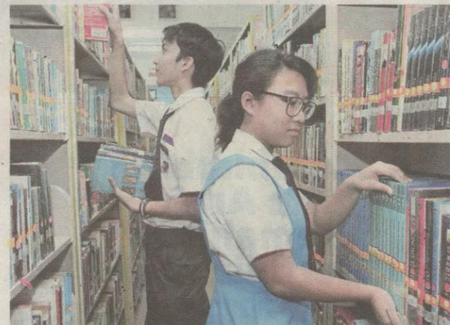
Pelajar memilih buku di perpustakaan.