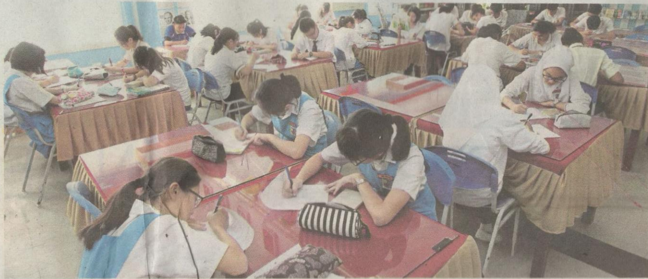
Pelajar mengulang kaji pelajaran di perpustakaan.