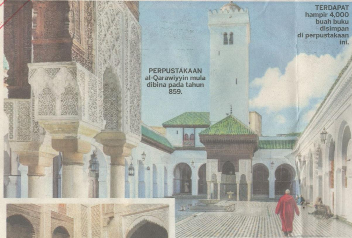
PERPUSTAKAAN al-Qarawiyyin mula dibina pada tahun 859.

TERDAPAT hampir 4,000 buah buku disimpan di perpustakaan ini.