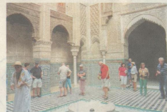
PUSAT ilmu ini dibuka kepada pelawat pada awal tahun ini.