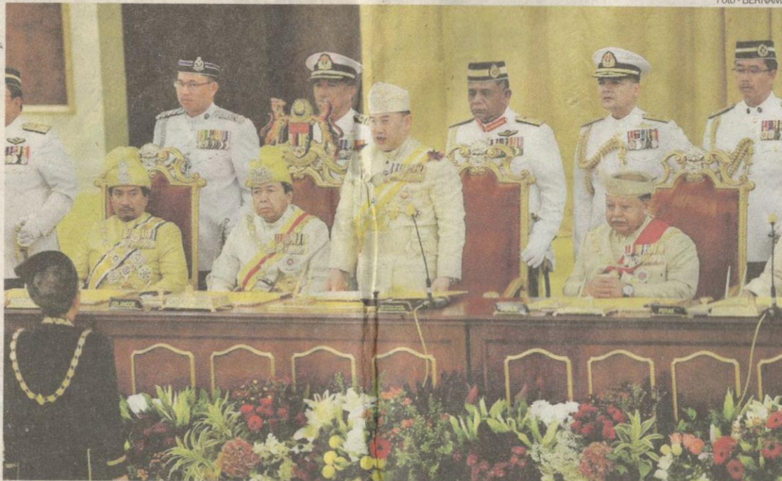
Sultan Muhammad V berkenan melafaz sumpah memegang jawatan sebagai Yang di-Pertuan Agong ke-15 di Istana Negara pada 13 Disember 2016.