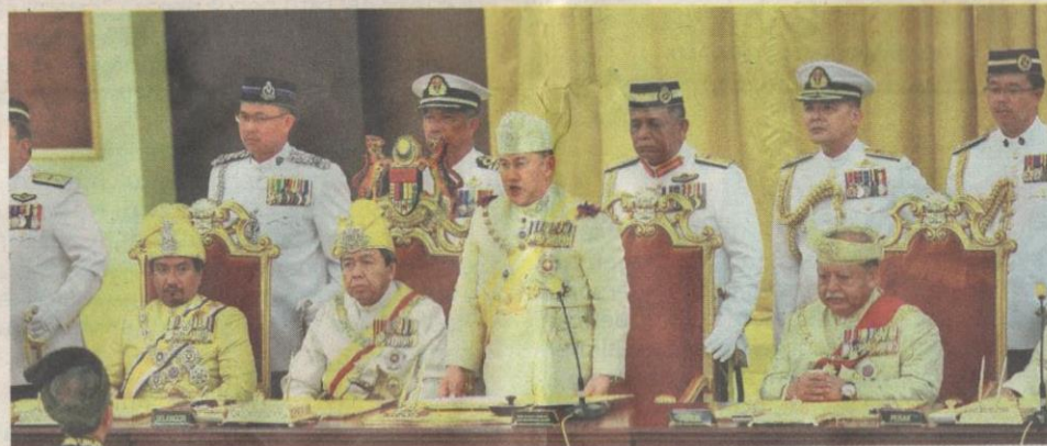
SULTAN MUHAMMAD V (tengah) berkenan melafaz sumpah memegang jawatan sebagai Yang di-Pertuan Agong ke-15 pada Istiadat Mesyuarat Majlis Raja-Raja Ke-244 (Khas) di Istana Negara, Kuala Lumpur pada 13 Disember tahun lalu.

yang mempunyai raja iaitu Kedah, Kelantan, Terengganu, Pahang, Perlis, Perak, Selangor, Johor dan Negeri Sembilan.