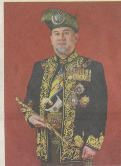
PERTABALAN Sultan Muhammad V sebagai Yang di-Pertuan Agong ke-15 esok mencerminkan kekukuhan sistem raja berperlembagaan di Malaysia.

“Sistem penggiliran penting kerana ia mencerminkan kedaulatan negara dipegang oleh raja-raja secara bergilir setiap lima tahun selain melangsungkan