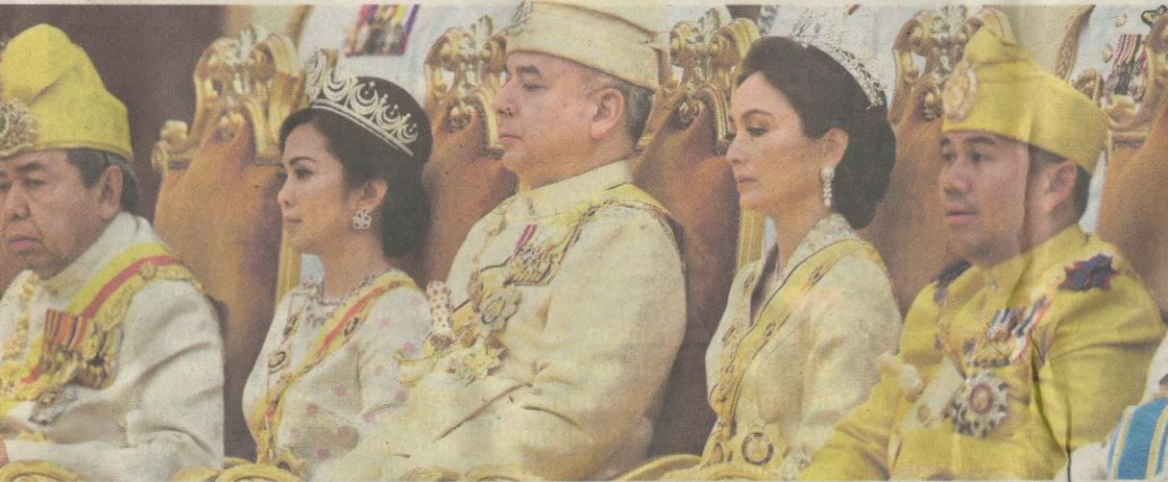
Di kiri, Sultan Selangor Sultan Sharafuddin Idris Shah, Tengku Permaisuri Selangor, Tengku Permaisuri Norashikin, Sultan Perak Sultan Azlan Shah, Raja Permaisuri Perak Tuanku Zara Salim, Tengku Mahkota Kelantan Tengku Dr Muhammad Faiz Petra berkenan menghadiri Istiadat Pertabalan Sultan Muhammad V sebagai Yang di-Pertuan Agong Ke-15.