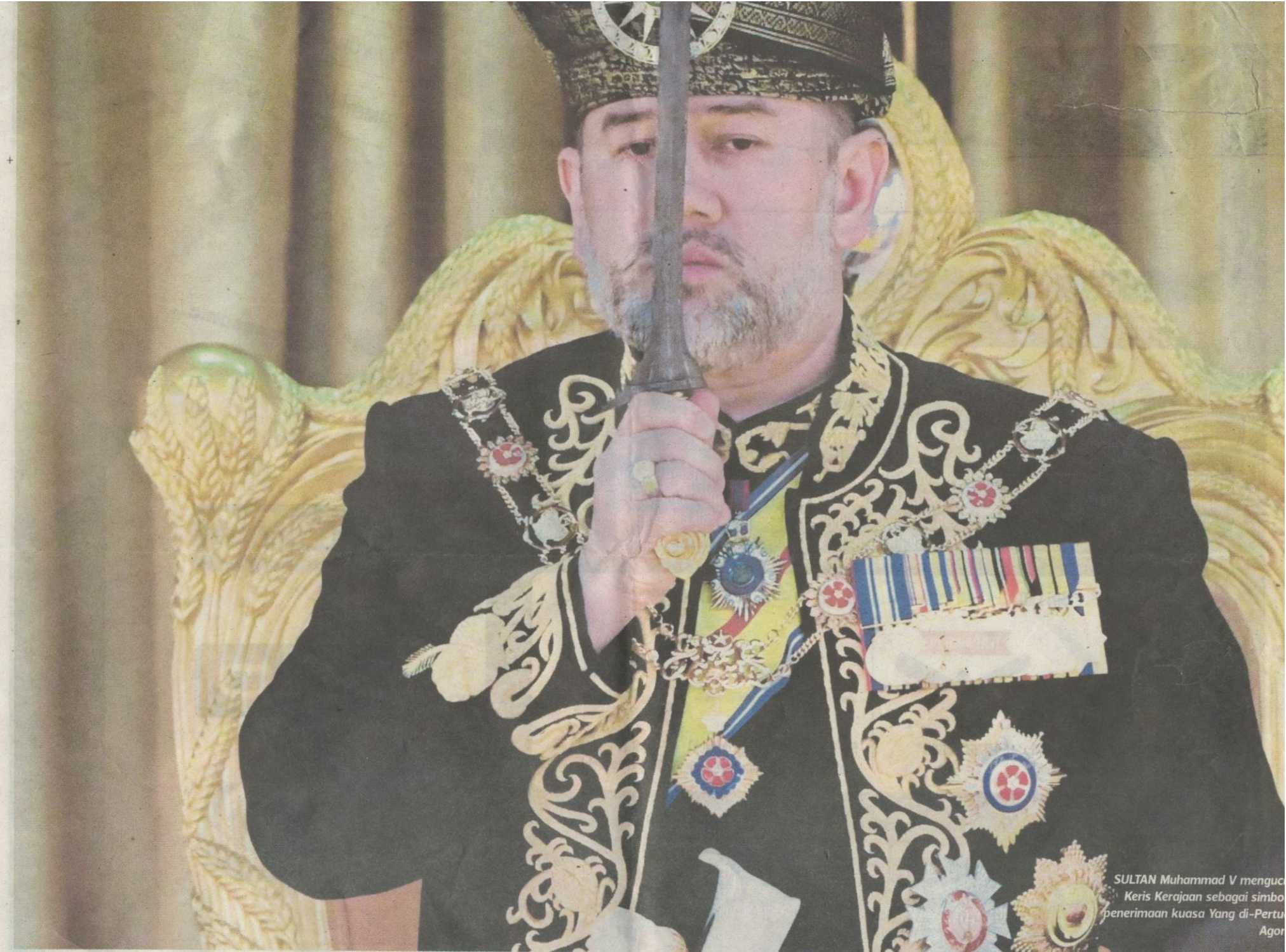
SULTAN Muhammad V mengucap Keris Kerajaan sebagai simbo penerimaan kuasa Yang di-Pertu Agon