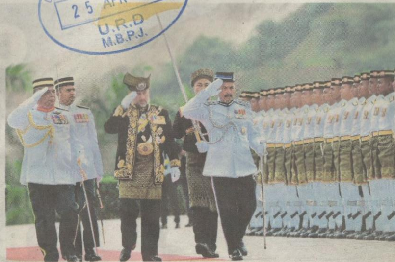
SULTAN Muhammad V berkenan memeriksa Pasukan Kawalan Kehormat daripada anggota Batalion Pertama Rejimen Askar Melayu Diraja di Istana Negara, semalam.