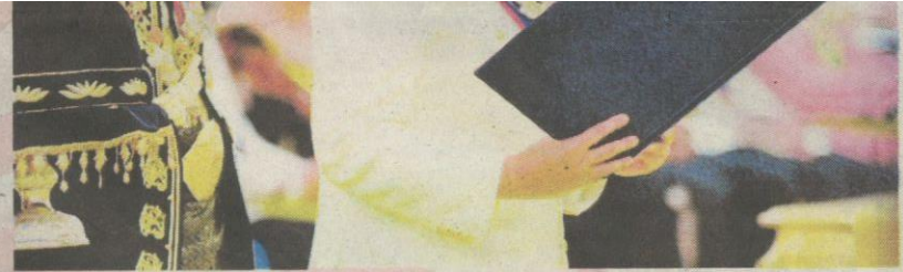
NAJIB menyampaikan Ucapan Tahniah dan Ikrar Taat Setia Kerajaan dan Rakyat Malaysia pada Istiadat Pertabalan Yang di-Pertuan Agong Ke-15.

Sejurus itu lagu Negaraku dimainkan sekali lagi dan tembakan meriam sebanyak 21 das dilepaskan. Perdana Menteri kemudian sekali lagi menghadap Seri Paduka untuk mempersembahkan Ucapan Tahniah dan Taat Setia atas pertabalan baginda sebagai mewakili kerajaan dan rakyat. - BERNAMA