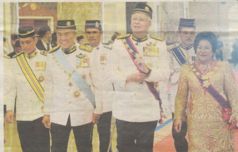
Najib dan isteri, Datin Seri Rosmah Mansor serta Ahmad Zahid berangkat ke Balairung Seri pada Istiadat Pertabalan Yang di-Pertuan Agong Ke-XV di Istana Negara, semalam.