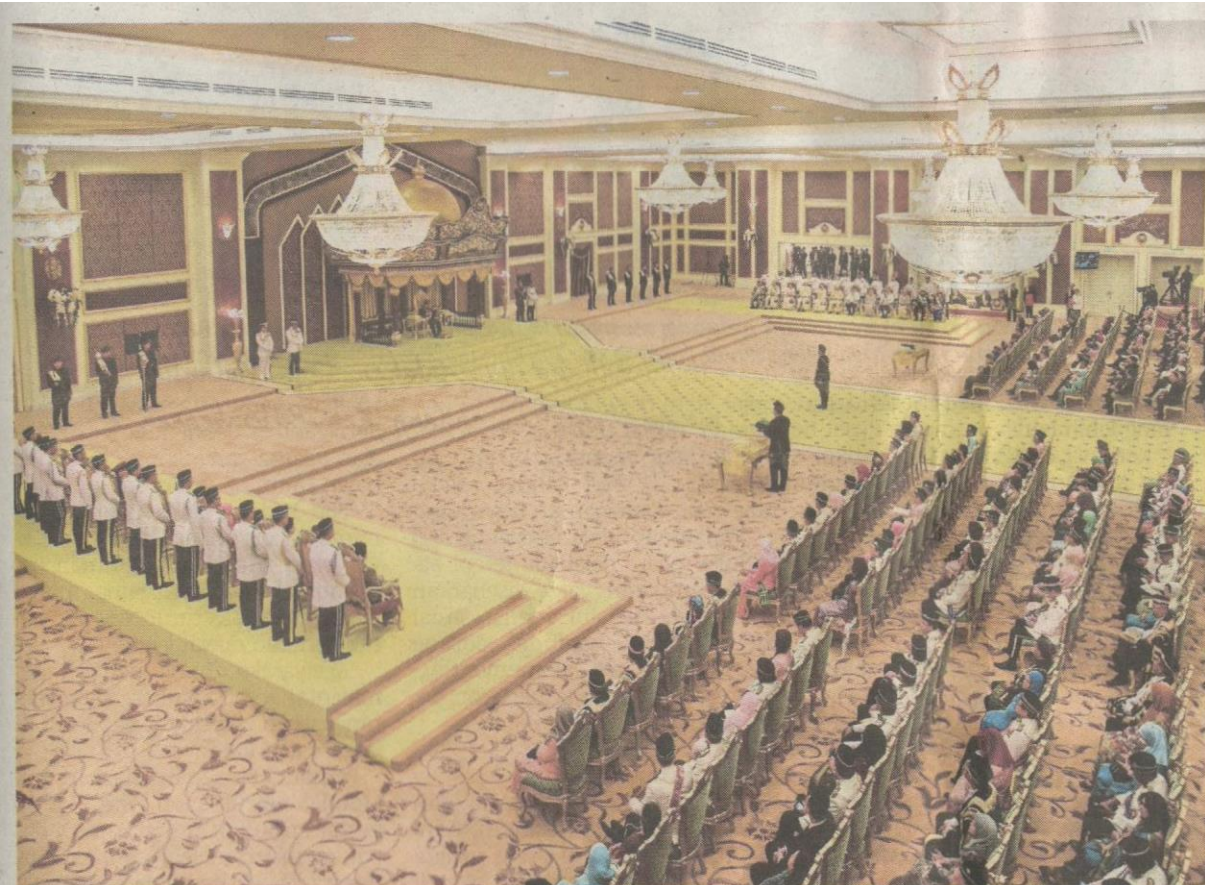
Istiadat Pertabalan Yang di-Pertuan Agong Ke-15 dihadiri kira-kira 800 tetamu di Istana Negara, semalam.

Ia disusuli dengan laungan Daulat Tuanku!, sebanyak tiga kali oleh Datuk Paduka Maharaja Lela, Istana