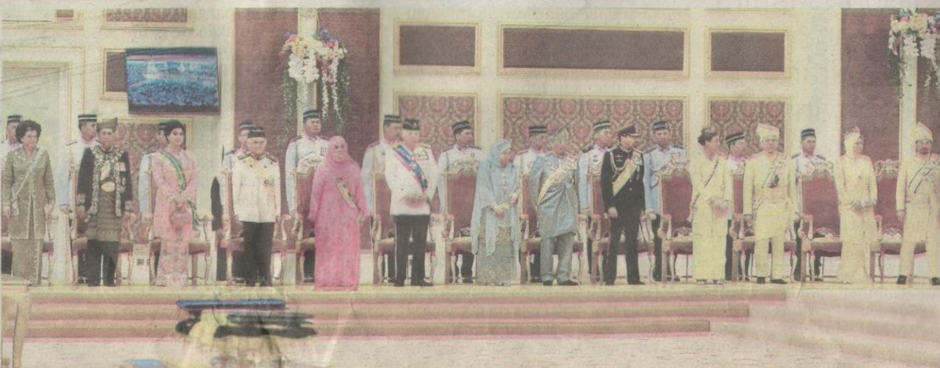
Raja-Raja Melayu bersama Permaisuri masing-masing serta wakil Raja-Raja Melayu dan Yang Dipertua Negeri berkenan berangkat ke Istiadat Pertabalan Yang di-Pertuan Agong, Sultan Muhammad V di Istana Negara, semalam.