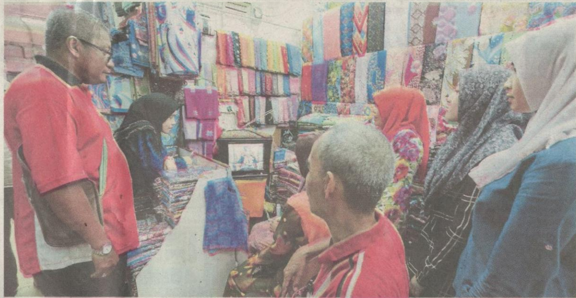
Rakyat Kelantan tidak melepaskan peluang menyaksikan Istiadat Pertabalan Yang di-Pertuan Agong Ke-15 secara langsung menerusi televisyen di Pasar Besar Siti Khadijah, Kota Bharu, semalam.

➔ Keperibadian, kepemimpinan Seri Paduka diyakini bawa lebih kemakmuran kepada Malaysia