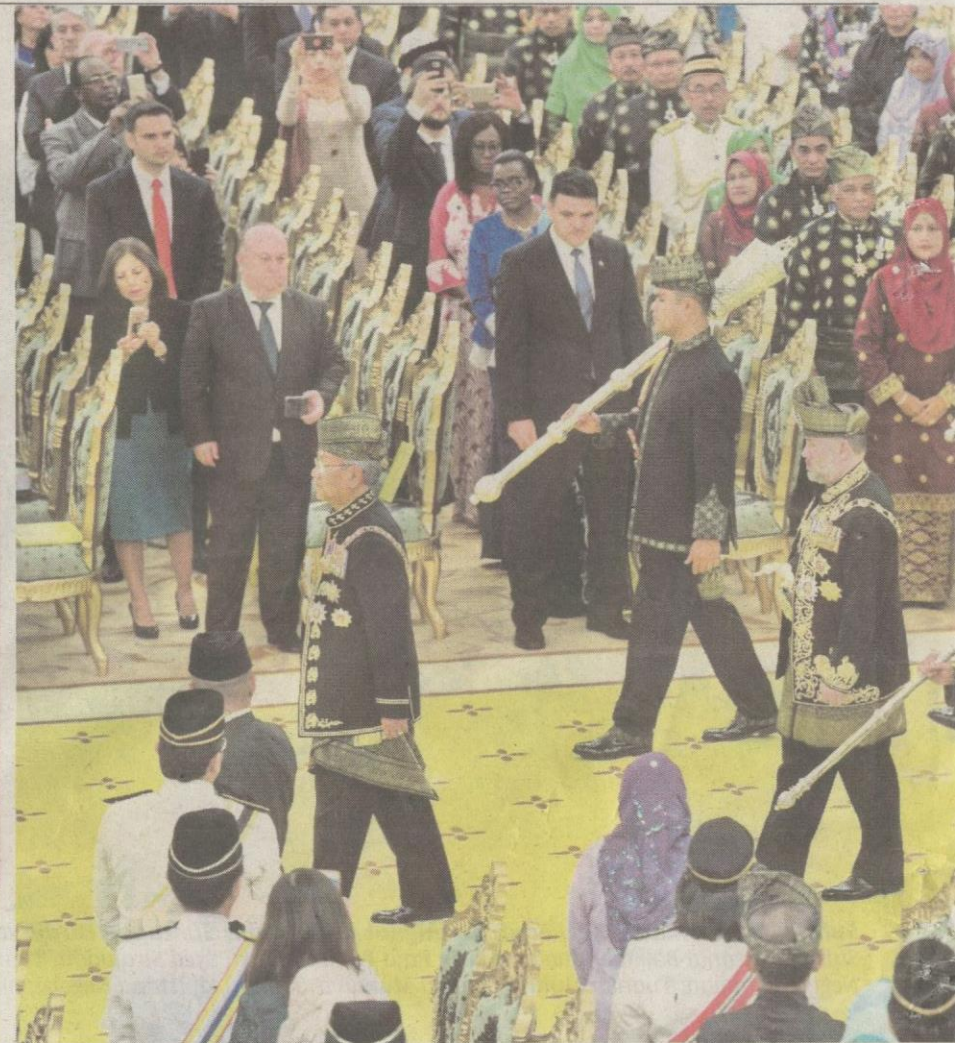
Seri Paduka diapit panglima yang membawa Cogan Alam dan Cogan Agama ketika keberangkatan masuk ke Balairung Seri, semalam.