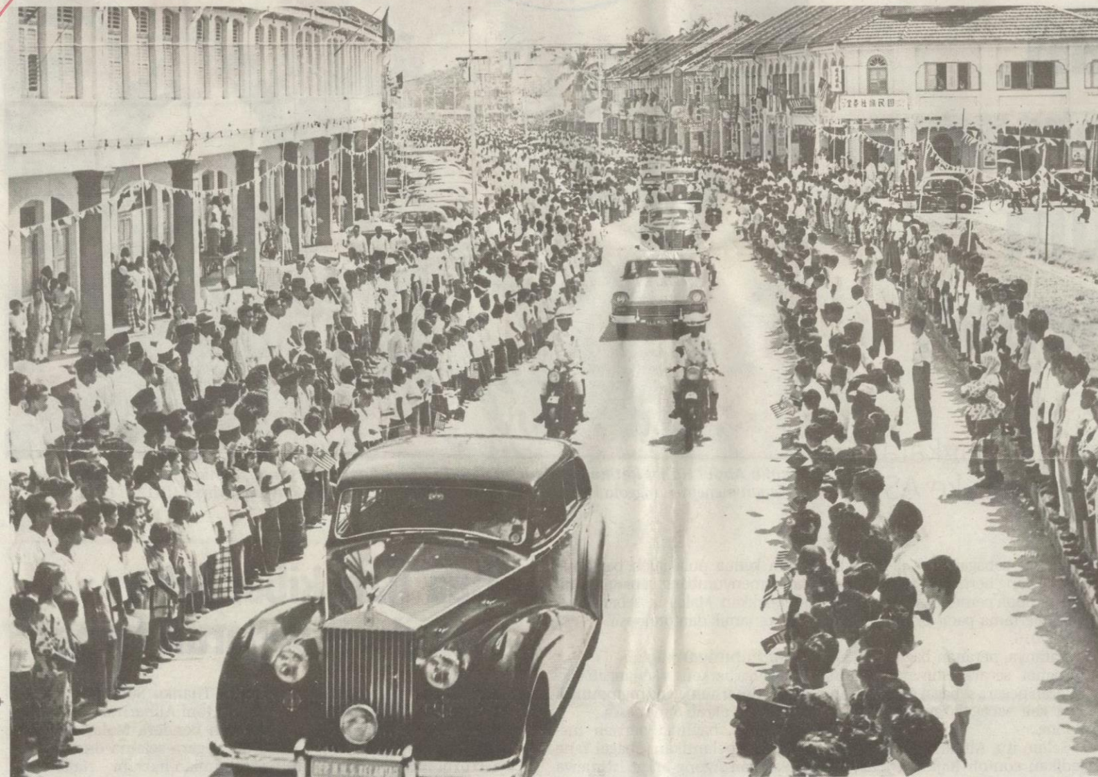
Rakyat menunggu di sepanjang jalan pada hari pertabalan Sultan Abdul Halim dan Sultanah Bahiyah sebagai Sultan dan Sultanah Kedah pada 20 Februari 1959.