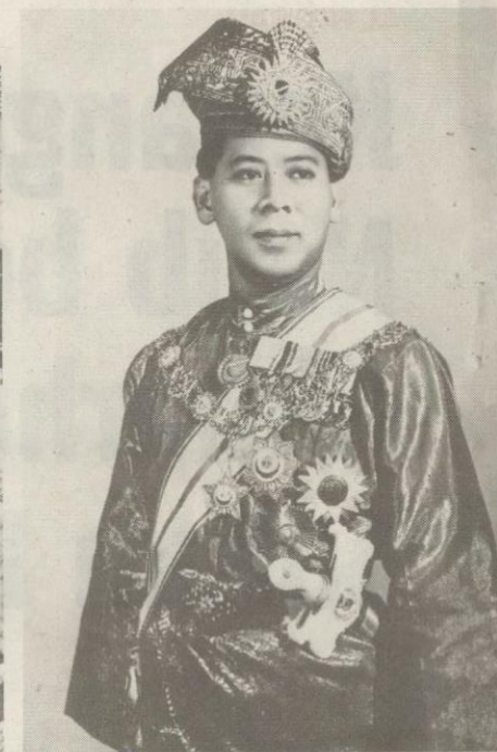
Gambar Tuanku Abdul Halim dirakam pada 19 Ogos 1965.