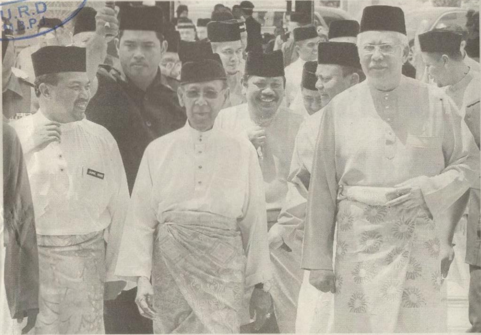
Tuanku Abdul Halim diiringi Perdana Menteri, Datuk Seri Najib Razak hadir menunaikan solat Jumaat di Masjid Putra, Putrajaya sempena Sambutan Ulang Tahun Hari Keputeraan Rasmi Seri Paduka Baginda Yang di-Pertuan Agong XIV pada 6 Jun 2014.