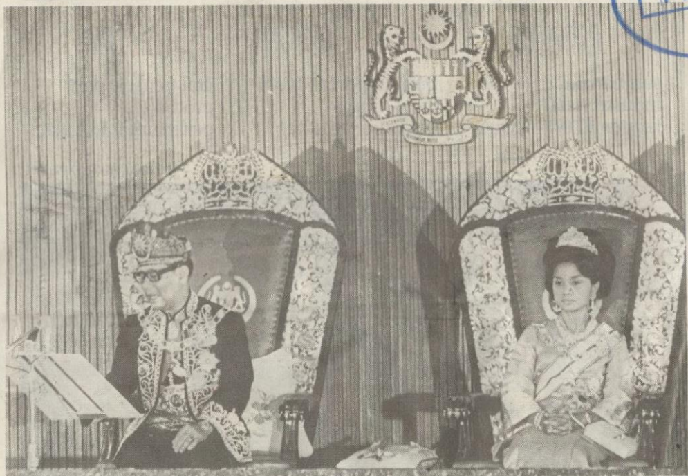
Tuanku Abdul Halim melafazkan titah baginda di depan anggota-anggota Dewan Negara dan Dewan Rakyat selepas memeriksa perbarisan kehormat di Bangunan Parlimen pada 23 Februari 1971.

UNIT RUJUKAN DAN DOKUMENTASI DITERIMA 12 SEP 2017 U.R.D M.P.A.