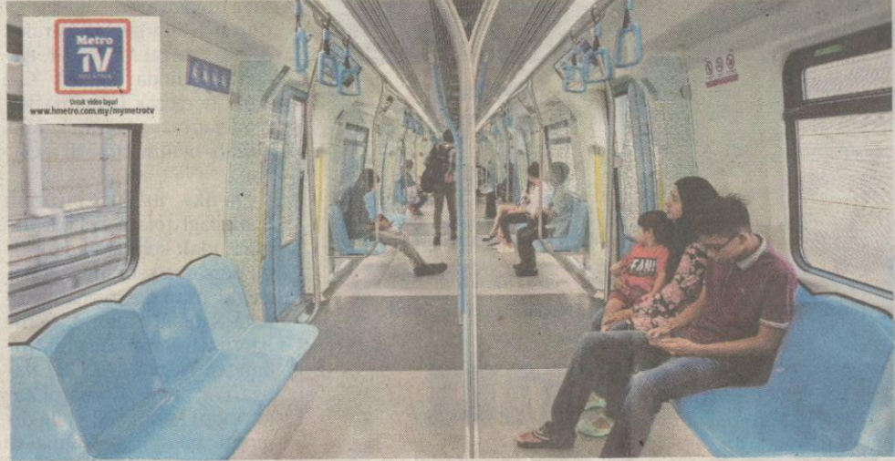
PERKHIDMATAN MRT jadi pilihan khususnya yang menetap dan bekerja berdekatan stesen MRT.

Tinjauan Harian Metro ke Stesen MRT Sungai Buloh, semalam mendapati peng-