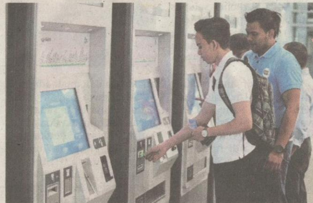
ORANG ramai membeli tiket MRT dengan kadar tambang antara RM1.20 hingga RM3.90 bergantung kepada jarak perjalanan.