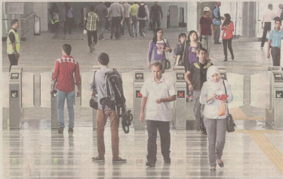
PENGUNA yang menggunakan khidmat MRT.