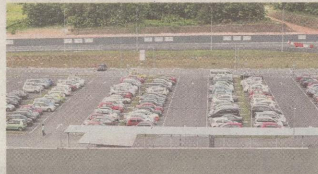
TEMPAT letak kenderaan di Stesen MRT.

khidmatan percuma selama sebulan, seramai 1.2 juta pengguna dicatatkan dengan anggaran 27,000 hingga 30,000 penumpang setiap hari.