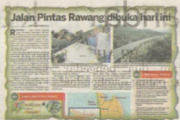
KERATAN Kosmo! semalam.

Sementara itu, seorang lagi penduduk di pekan Serendah,