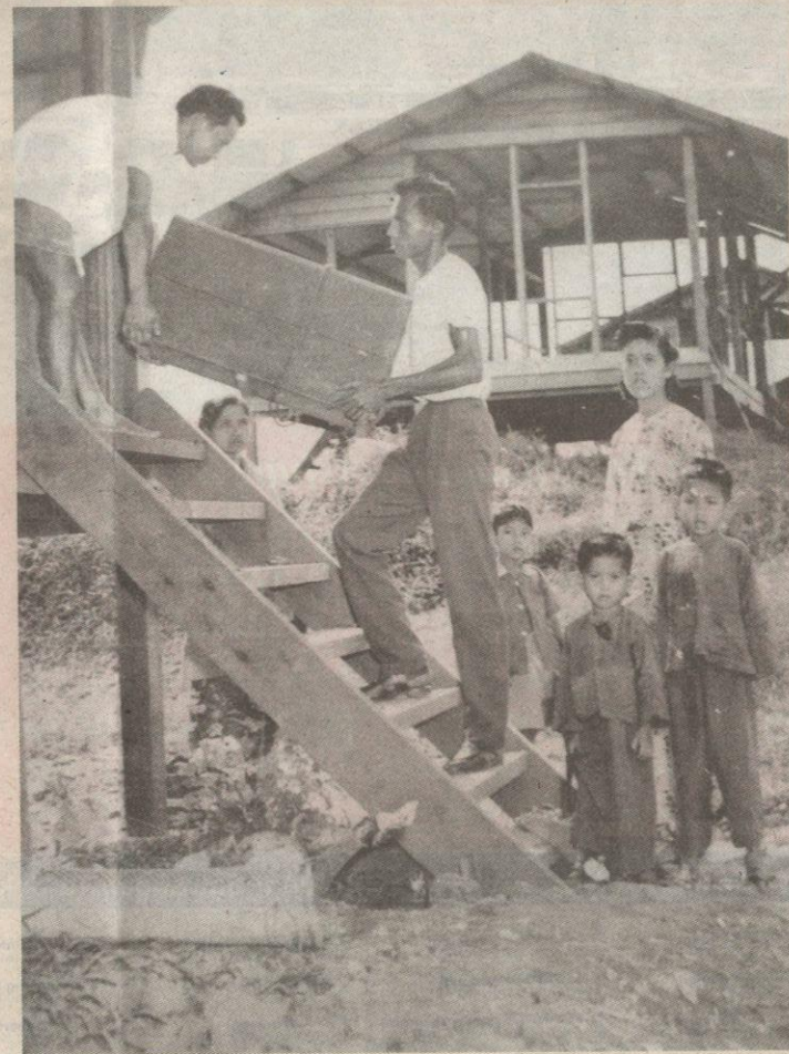
Peneroka pindah masuk rancangan di tahun 60-an.

"Kita mahu menjadikan Felda sebagai komuniti contoh dan terbuka kepada orang luar. Mereka boleh datang (menginap) dan menyertai kegiatan kita yang akhirnya memberi nilai tambah kepada masyarakat itu sendiri," katanya.