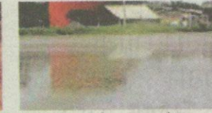
Sisa kilang minyak sawit Cecair yang dihasilkan proses steril dan pengilangan