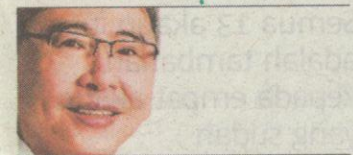
Komoditi hari ini dan hari muka Mah Siew Keong mahsiewkeong@mpic.gov.my

Tidak ramai rakyat Malaysia mengetahui pucuk, batang, tandan buah kosong (EFB), cengkerang isirong sawit (PKS), serat mesokarp sawit, pepejal isirong sawit (PKC) dan efluen kilang minyak sawit (POME) adalah hasil biojisim kelapa sawit yang berpotensi menjana kekayaan negara.