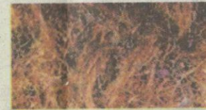
Serat Diperoleh selepas CPD diperah daripada buah sawit