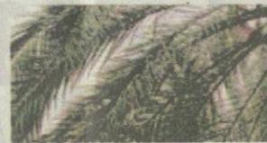
Pelepah Daun pokok kelapa sawit