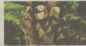
Batang Batang pokok didapati pada akhir pusingan ladang