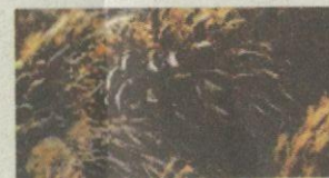
Tandan buah kosong Diperoleh selepas buah sawit dileraikan