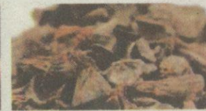
Tempurung Diperoleh selepas minyak isi sawit diperah