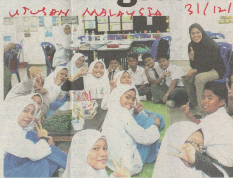
MASA yang diperuntukkan untuk sesi kelas Pendidikan Islam hanya sebahagian kecil daripada masa keseluruhan proses pembelajaran di sekolah.