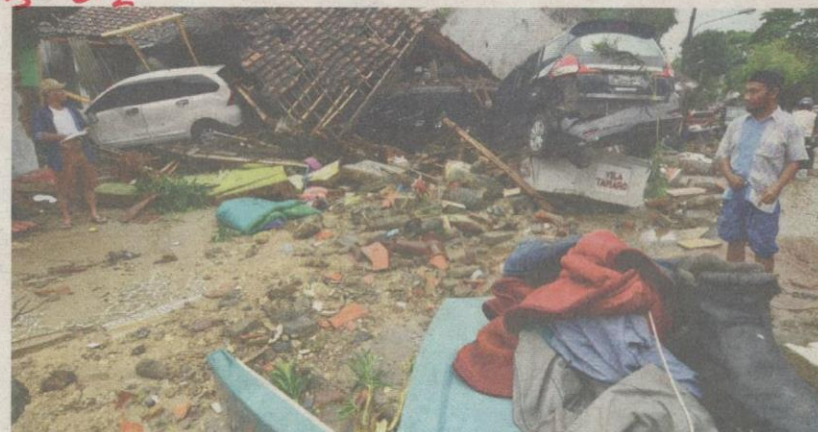
PENDUDUK kembali ke rumah masing-masing untuk melihat kesan kerosakan selepas dilanda tsunami di Carita semalam.

Anak Krakatau adalah sebuah pulau gunung berapi