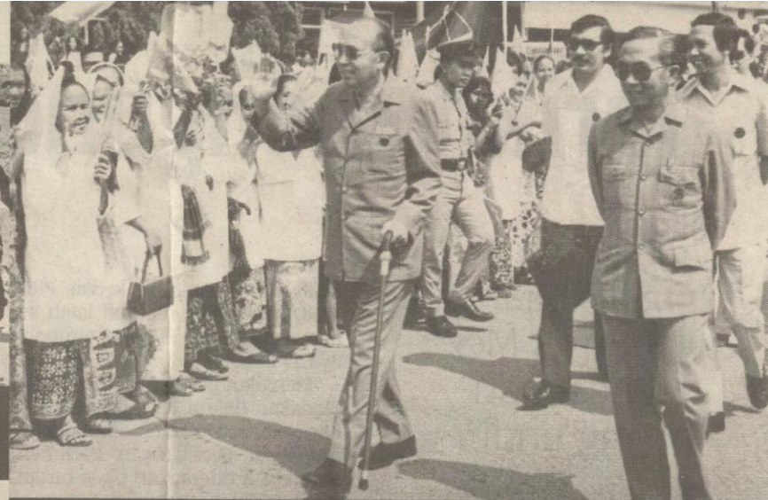
Pada 19 Ogos 1974. Tun Abdul Razak bersama Datuk Abdul Rahman Yakub disambut lebih 1,000 orang penyokong Barisan Nasional setibanya di Kuching

Parti Perikatan menjenamakan mereka sebagai Barisan Nasional (BN) dengan menggunakan simbol dacing. BN terdiri daripada UMNO, MCA, MIC, PAS, PPP, GERAKAN, Parti Bersatu Rakyat Sarawak (SUPP), Parti Perikatan Sabah dan Parti Pesaka Bumiputera Bersatu (PBB). Hanya DAP dan Parti Sosialis Rakyat Malaysia (PSRM) enggan bergabung. Kemenangan besar pada pilihan raya itu menyaksikan BN memenangi 135 daripada 154 kerusi yang dipertandingkan. Selepas pemecatannya, Dr Mahathir kembali menyertai UMNO dan dipilih ke Parlimen serta dilantik sebagai Menteri Pendidikan. Pada tahun 1976, Tun Abdul Razak meninggal dunia akibat penyakit leukemia dan Datuk Seri Najib Razak bertanding pada pemilihan seterusnya, sekali gus menjadikan beliau calon paling muda menang tanpa bertanding