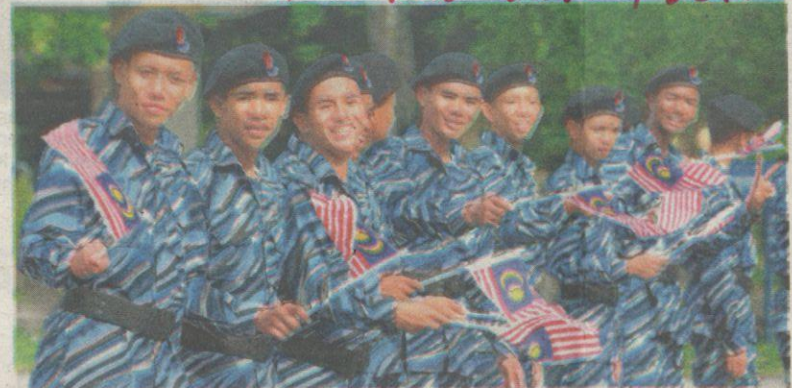
PROGRAM Latihan Khidmat Negara telah diperkenalkan kerajaan BN sejak tahun 2004 melibatkan pelajar lepasan SPM.

“Justeru, KBS telah menghubungi pihak Khazanah Nasional untuk mengadakan perjumpaan dalam tempoh terdekat bagi mengadakan kolaborasi supaya modul baharu tersebut benar-benar memperkasakan anak muda,”