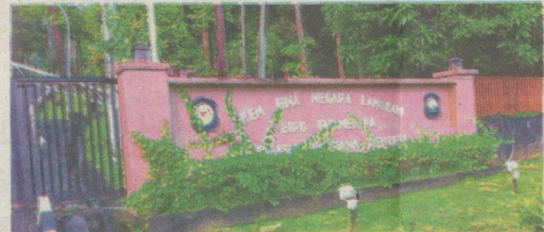
SALAH sebuah Kem Bina Negara di bawah Biro Tatanegara yang menjadi lokasi latihan dan kursus untuk peserta terutamanya golongan belia.

katanya pada sidang akhbar di lobi Parlimen di sini semalam.