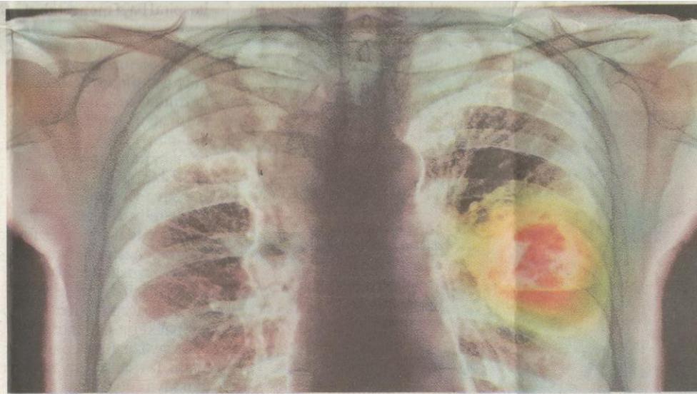
MEROKOK tetap diletakkan sebagai punca utama.

pencegahan itu adalah kaedah terbaik untuk menjaga kesihatan diri secara keseluruhannya. Walaupun ia tampak ideal di atas kertas dan di dada poster kempen, hakikatnya ramai yang kurang memberi perhatian kepada pencegahan penyakit khususnya penyakit kronik seperti kanser. Tidak