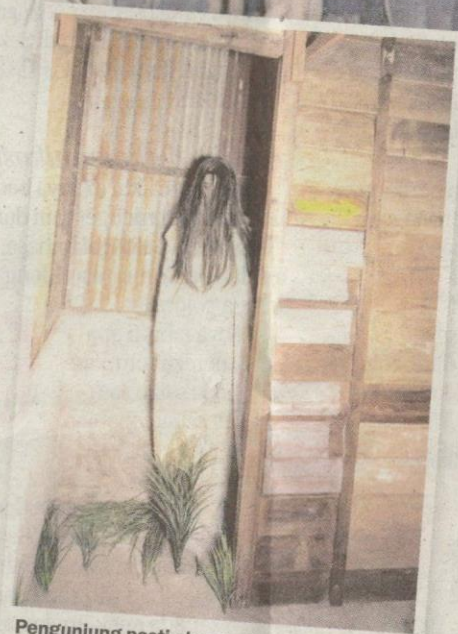
Pengunjung pasti akan terkejut dengan susun atur hantu yang ditempatkan di dalam muzium berkenaan.

Muzium Hantu yang terletak di Lebu Melayu dibuka setiap hari.