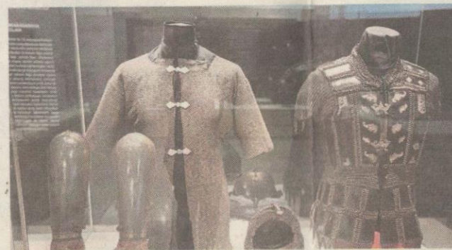
BARANGAN dan peralatan persenjataan antara yang menarik untuk dilihat.