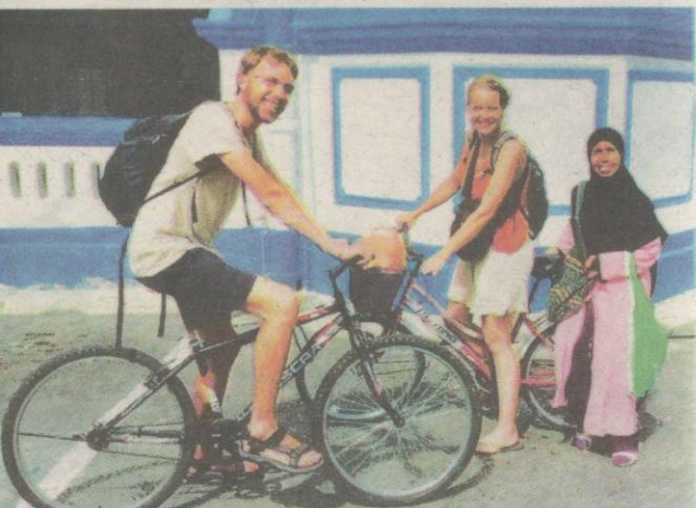
KAKITANGAN yang mesra pelancong menjadikan Masjid Panglima Kinta sering dikunjungi.