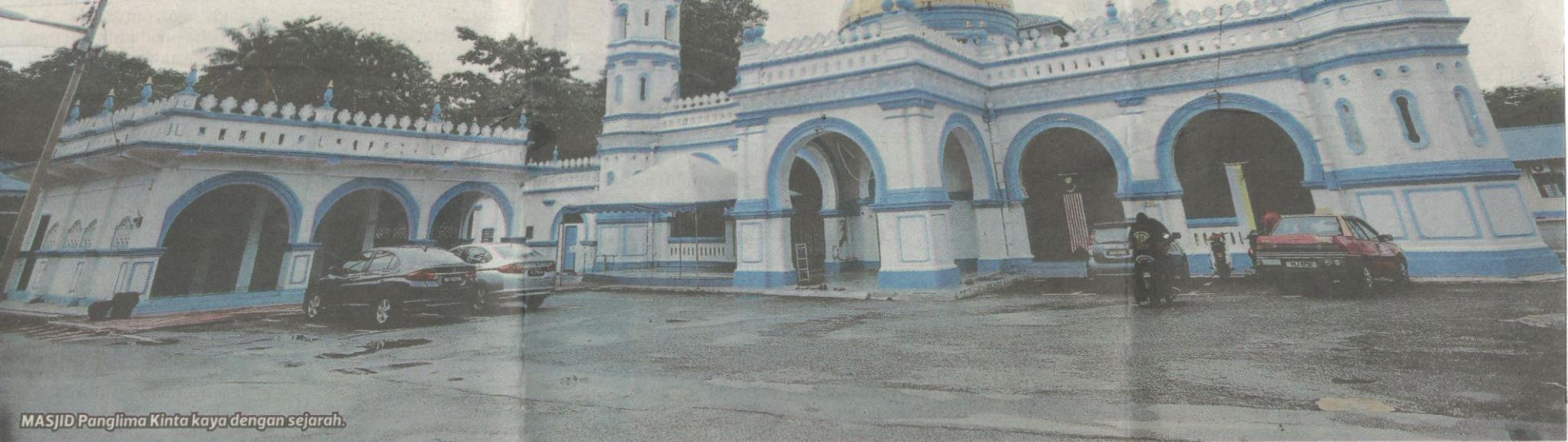
MASJID Panglima Kinta kaya dengan sejarah.