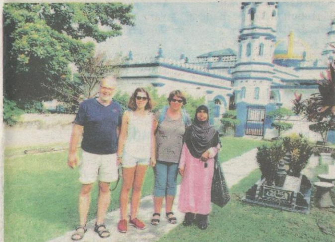
KEUNIKAN reka bentuk menjadi tarikan pelancong.