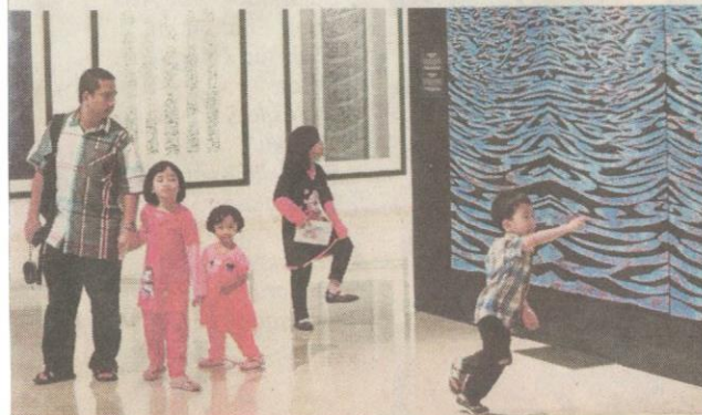
UMLAH galeri pameran yang luas dan pelbagai konsep sesuai untuk dilawati seisi keluarga.

Muzium Kesenian Islam Kuala Lumpur hanya ditutup pada Aidilfitri