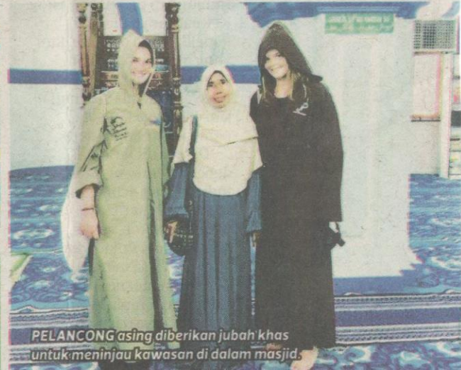
PELANCONG asing diberikan jubah khas untuk meninjau kawasan di dalam masjid.